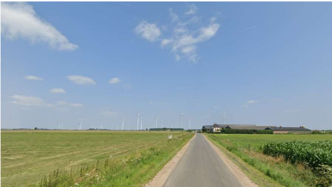
Afbeelding 3.4 Visualisatie voorbeeldopstelling 1_2.1 Geluid