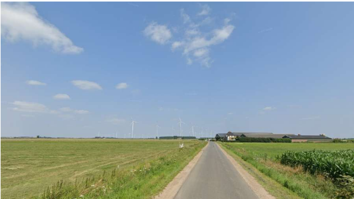
Afbeelding 3.6 Visualisatie voorbeeldopstelling 1_3.1 Landschap