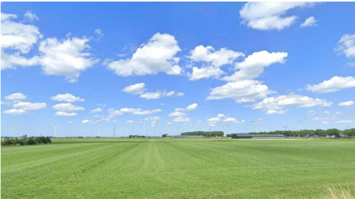
Afbeelding 4.1 Visualisatie voorbeeldopstelling 2_1.1 Basis