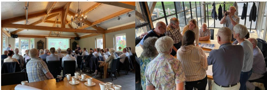
Sfeerimpressie bewonersavond Blerick, Hout-Blerick, Boekend

In Boekend is verkeersveiligheid en bereikbaarheid ook een belangrijk aandachtspunt (maar ook parkeerdruk en sluipverkeer). Bij de woningbouwopgave is het vooral belangrijk dat er kleinschalig wordt bijgebouwd voor de lokale behoefte, met veel aandacht voor starters en senioren. De toekomst van de sportvelden riep discussie op; het wordt door veel inwoners in elk geval als kansrijke transformatielocatie genoemd met een mix aan functies, maar wel voor de eigen behoefte.