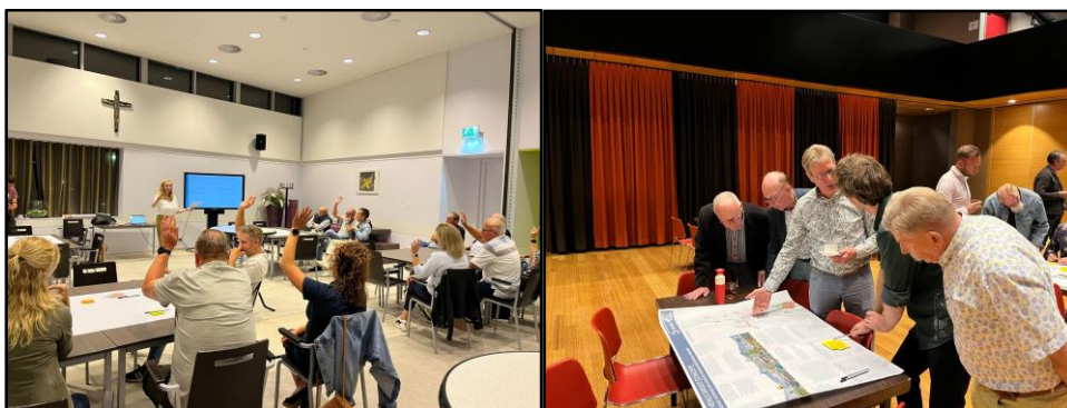
Impressie Ateliers Venlo 2040 #2, in Belfeld (links) en Blerick (rechts)

eenduidig als ze wellicht op het eerste gezicht suggereerden. Aan tafel werd dan ook vaak benoemd dat keuzes niet altijd “of-of” zijn. “En-en” is ook vaak mogelijk. Bewoners deelden daarnaast hun zorgen over vraagstukken en gaven mee dat er ook lokaal in de dorpen al recente plannen zijn gemaakt die ze graag als input voor de omgevingsvisie willen meegeven (o.a. Dorpsontwikkelplan ‘t Ven, Panorama Arcen en de visie op Hout-Blerick). We sloten de avond af met een ronde langs de posters met de sporen. Deelnemers konden met stickers aangeven welke elementen aanspraken (groen) en welke elementen niet (rood). Ook konden deelnemers aangeven bij welke uitgangspunten er nog wel wat ambitie bij kon en welke zaken ontbraken.