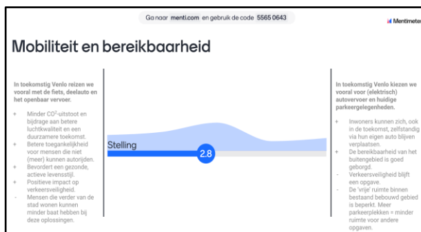
Impressie deelsessies Atelier Venlo 2040 #1, met daarbij één van de resultaten van de interactieve peilingen.