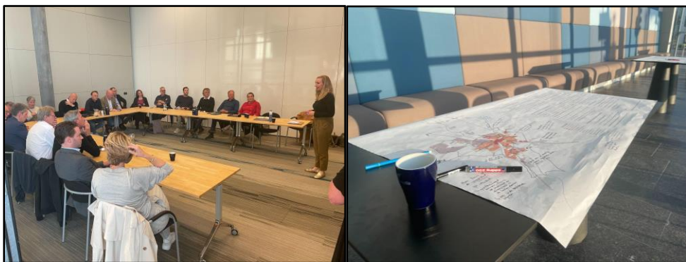
Impressie stakeholdersessie op 11 juni 2024 in het Stadskantoor in Venlo

Op 11 juni 2024 vond in het Stadskantoor in Venlo de tweede stakeholdersessie plaats. Er waren 16 vertegenwoordigers van verschillende organisaties aanwezig, namelijk: Adviesraad Sociaal Domein, MKB Limburg, Limburgs Museum, Fietsersbond Venlo, Centrummanager ondernemers stadsdeel Blerick, Centrummanager BIZ Centrum Tegelen, Fontys, Venlo Partners, Antares, Glastuinbouw Nederland, HAS Green academy, LIOF, Limburgs Landschap, Ondernemersvereniging binnenstad Venlo en Kerobei.