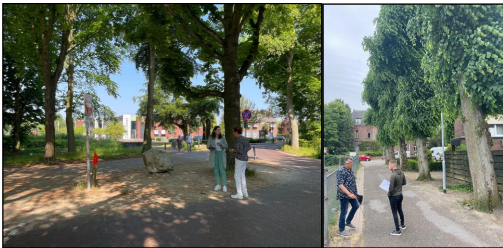
Impressies straatgesprekken 6 en 7 juni 2023

Op 6 en 7 juni 2023 vonden straatgesprekken plaats, waarbij mensen werden bevraagd op kwaliteiten, opgaven en dromen die ze voor de gemeente Venlo zien. Het doel van deze gesprekken was om mensen fysiek te bereiken en om meer kwalitatieve input op te halen voor de omgevingsvisie (quotes, verhalen). Een gesprek leent zich ook om door te vragen waarom mensen iets vinden. Deze gesprekken zijn gevoerd in de dorpen Arcen, Lomm, Velden, Tegelen, Steyl en Belfeld. Op ontmoetingsplekken in de openbare ruimte – zoals de plaatselijke supermarkt, een hondenuitlaatplek of het dorpsplein – zijn mensen aangesproken en geïnterviewd. In totaal zijn er 30 straatgesprekken gevoerd met dorpsbewoners, variërend van leeftijd, geslacht en woonplaats.