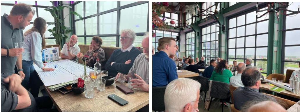
Sfeerimpressie bewonersavond Venlo

Inhoudelijk gaven deelnemers aan dat er in Venlo een aantal belangrijke punten zijn die moeten worden aangepakt. Het gaat dan vooral om sociaal-economische opgaven, zoals de uitdagingen rondom arbeidsmigranten en sociaal zwakkeren in de wijk. Ook overlast, drugsproblematiek en armoede werden vaak benoemd. Deze ontwikkelingen hebben momenteel een negatief effect op de leefbaarheid en sociale cohesie in de Venlose wijken. Er liggen daarom kansen om een divers, gevarieerd woningaanbod te creëren, zodat de bevolkingsamenstelling beter gespreid wordt. Voor woningbouw ziet men kansen in grote transformatielocaties zoals de sportvelden en het Middengebied. Ook kan er verder worden ingespeeld op de sterke punten van Venlo: het aantrekkelijke stadscentrum, het cultuuraanbod en de verbinding met de Maas.