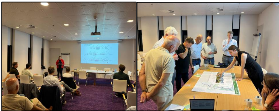
Impressie stakeholdersessie op 12 september 2023 in het Maastheater Venlo

Op 12 september 2023 vond in het Maastheater een sessie met stakeholders plaats. Hiervoor is een zeer brede groep organisaties uitgenodigd, maar niet iedereen gaf gehoor aan de uitnodiging. Uiteindelijk hebben we met 18 stakeholders aan tafel gezeten, bestaande uit vertegenwoordigers van de volgende organisaties: Crossroads Limburg, Fietzersbond, VVN NL Afdeling Venlo, Antares, Steyl inspireert, Venlo Partners, Kerobei, Incluzio, Beej Benders, Vastgoedeigenaren Venlo, Glastuinbouw Nederland regio Limburg, Adviesraad Sociaal Domein Venlo, Supply Chain Valley, Limburgse Land en Tuinbouwbond, Staatsbosbeheer, Stichting Akkoord, Canon PP, Urban Dance Studio, Limburgs Museum, Gilde Opleidingen, LIOF en VVV-Venlo. Vanwege het zeer brede spectrum aan vertegenwoordigers was het waardevol om de verschillende perspectieven bij elkaar te brengen.