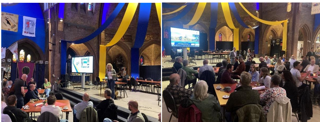
Sfeerimpressie bewonersavond Tegelen, Belfeld, Steyl

In het gesprek over Tegelen viel meteen op dat de eigen identiteit hier ook erg belangrijk is. Het dorp heeft haar eigen DNA, en moet daarom niet vastgroeien aan Venlo. Tegelen heeft alle basisvoorzieningen en ook op het gebied van zorg zijn de voorzieningen goed. De aanwezigheid van het treinstation wordt als positief ervaren. In de kern is nog veel (zware) industrie te vinden, uitplaatsing van deze industrie biedt weer kansen voor woningbouw en mogelijkheden voor Tegelen om zich verder te ontwikkelen. Hierbij wel de oproep om oog te houden voor voldoende groen.