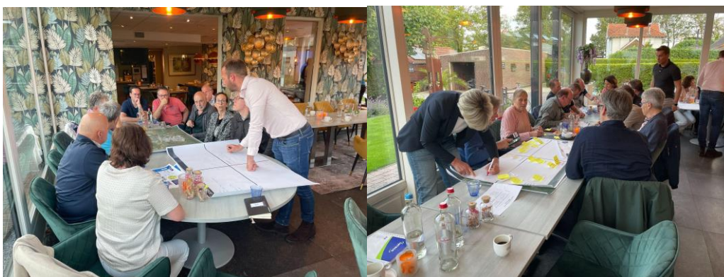
Sfeerimpressie bewonersavond Arcen, Lomm, Velden

Het thema woningbouw is voor alle drie de dorpen het belangrijkste. Dit moet volgens bewoners echt meer dan 1% per jaar zijn. De genoemde 1.300 woningen in 15 jaar voor de dorpen is in hun beleving te weinig om de leefbaarheid te waarborgen; dit aantal mag wel ambitieuzer. En daarnaast moet er niet alleen duur worden gebouwd, maar juist in het goedkopere segment, inclusief sociale huurwoningen. Alle sterke punten, zwakke punten, kansen en bedreigingen van alle drie de dorpen zijn benoemd in de bijlage.