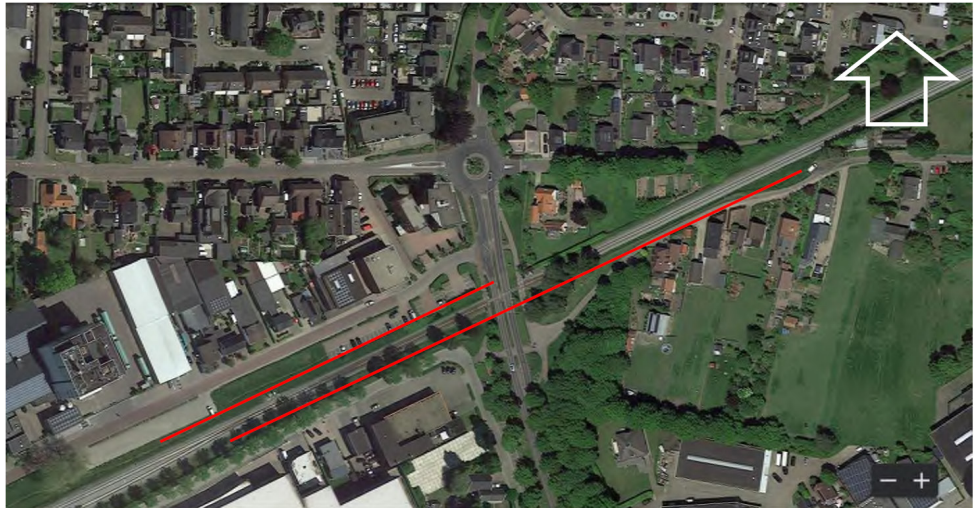
Figuur 4: Cluster 2 in Didam, met voorgestelde maatregelen (TROC's, rode lijnen)

Cluster 2 vormt een uitzondering: hier blijkt een ondergronds trillingsscherm van EPS van 0,5 m dikte en 2 m diepte op ca. 5 m uit het hart van het spoor doelmatig en effectief. Dit heeft onder andere te maken met het feit dat hier de spooruitbreiding aan de noordkant plaatsvindt en kabels en leidingen toch al vanwege het project omgelegd moeten worden. Vanwege de Oude Beekseweg die hier vlak tegen het huidige spoor ligt is gekozen om middels een S-bocht het spoor van de zuid- naar de noordkant te brengen, waardoor je aan beide zijde ten westen van de overweg Bievankweg in het kader van het spoorwegproject al aanpassingen moet doen. Bovendien vindt de uitbreiding hier vooral op gemeentegrond plaats, zodat extra aankoop van gronden nauwelijks nodig is. Zie figuur 4. De ondergrondse TROC's zijn hier weergegeven als de rode lijnen.