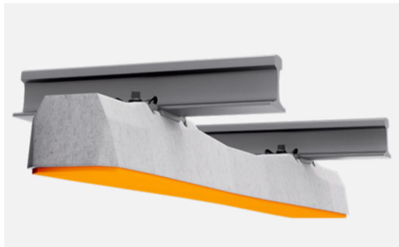
Figuur 2: Under Sleeper Pads onder de dwarsliggers

De meest doelmatige maatregelen (meeste effect per bestede euro) zijn zogenaamde Under Sleeper Pads (een soort rubberen matten onder de dwarsliggers die de trillingen dempen, zie figuur 2) of ondergrondse trillingenschermen (TRillingsreducerende Ondergrondse Constructies of 'TROC's') gemaakt van EPS (Expanded Polystyrene of piepschuim). De kosten voor een TROC bestaan niet alleen uit de kosten voor het ingraven van een EPS-wand, maar ook de bijkomende kosten zoals het verleggen van kabels en leidingen, aankoop van extra gronden, effect van archeologische waarden, herinrichting van het terrein, enz.