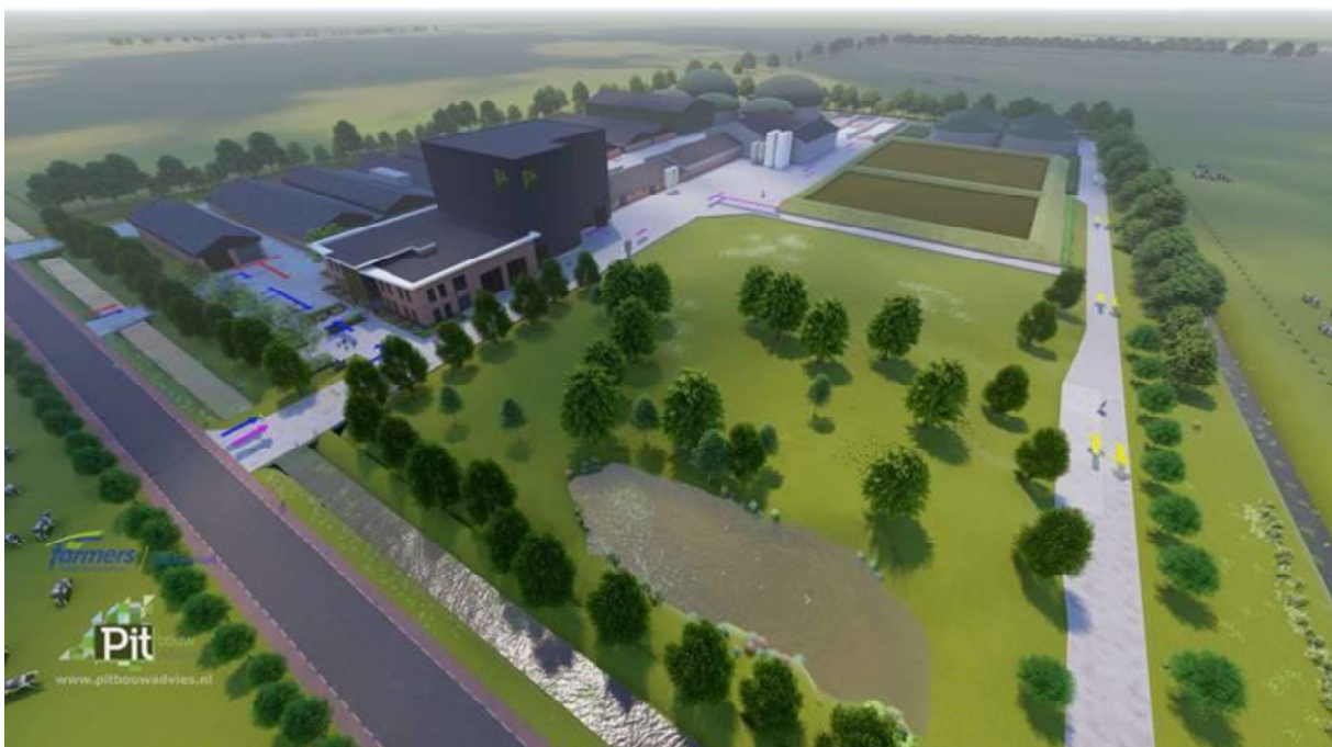
Figuur 3.1. Impressie van de voorgestane situatie.

De bestaande bebouwing blijft behouden, deze gebouwen vallen daarom buiten het feitelijke plangebied. Er worden enkele nieuwe gebouwen gerealiseerd: een kantoorpand, een mengvoerfabriek en zes silo's. De mengvoerfabriek wordt tegen een bestaand gebouw aangebouwd. Het kantoorpand wordt vervolgens weer tegen de mengvoerfabriek aangebouwd. De zes silo's worden vrijstaand. Daarnaast worden er extra toegangswegen en een vijver met nieuwe groen aangelegd. Een deel van de bestaande vegetatie en verharding wordt verwijderd. Mogelijk worden er enkele essen verwijderd en de sloot ten zuiden van de bestaande silo's gedempt. Figuur 3.1 geeft een impressie van de voorgestane situatie weer.