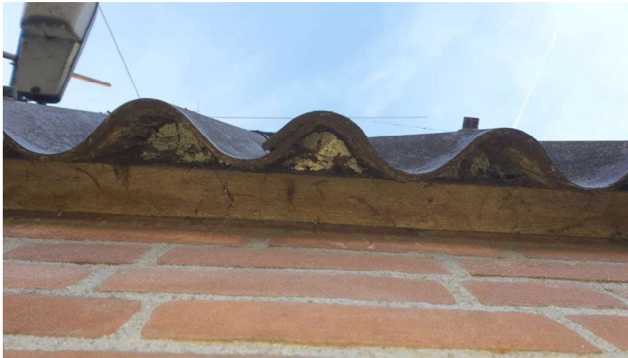
Figuur 4.4.1. Onder de golfplaten gevelbekleding is vogelschroot aanwezig. Vleermuizen kunnen hier niet onder de golfplaten kruipen.

De bomen in het plangebied (voornamelijk essen) bevatten geen vogelnesten of eekhoornnesten. Boomholtes zijn afwezig. De aanwezigheid van vleermuisverblijven en/of steenuilennesten is daardoor eveneens uitgesloten. Het is wel mogelijk dat de bomenrijen aan de noord-, west- en oostzijde van het plangebied fungeren als vliegroute of foerageergebied van vleermuizen. Vaste vliegroutes en belangrijke foerageergebieden van vleermuizen worden onder de Wet natuurbescherming als een voortplantingsplaats en rustplaats gezien (Ministerie van Economische zaken, 2016). Een aantal vleermuissoorten is daarom in tabel 4.5 opgenomen.