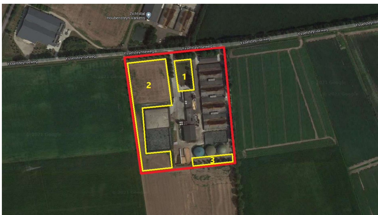
Figuur 4.1. Ligging van het plangebied (rood omlijnd).

Het plangebied bestaat uit 3 delen (zie figuur 4.1). Deelgebieden 1 en 2 bestaan grotendeels uit grasland met (naast grassen als Engels raaigras) algemene voorkomende planten als gele mosterd, vogelmuur, fluitenkruid, kruipende boterbloem, paarse dovennetel en zachte ooievaarsbek. In deelgebied 1 bevindt zich tevens een rij essen. In deelgebied 3 bevinden zich kaasjeskruid, riet, grote brandnetel, mijlganzenvoet, melkdistel, winterpostelein en klein kruiskruid. Tevens bevinden zich hier een sloot en een rij essen.