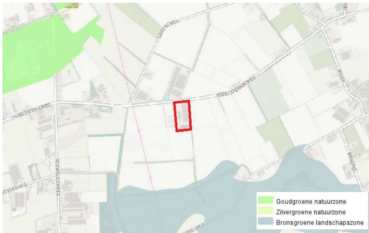
Figuur 4.3. Globale ligging van het plangebied (rood omlijnd) ten opzichte van het NNN (Goudgroene natuurzone).