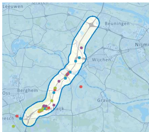
Figuur 2 Interactieve kaart screenshot