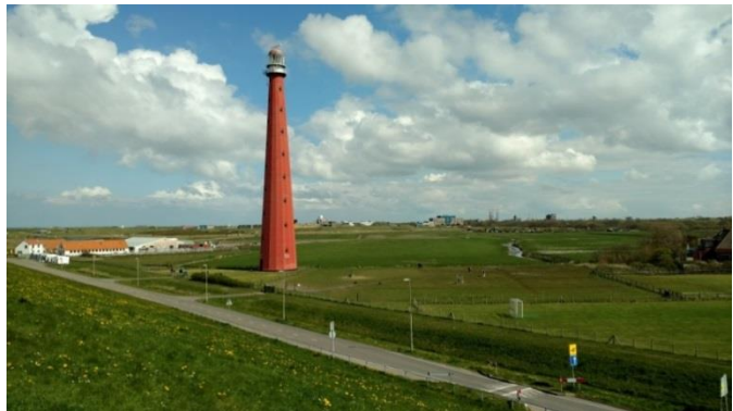
Afbeelding: De Huisduiner Polder en de iconische 'Lange Jaap'

Deze visie geeft een integrale ontwikkelrichting voor het dorp Huisduinen en haar natuurlijke omgeving en beschrijft de ambities om het dorp kleinschalig verder te laten ontwikkelen.