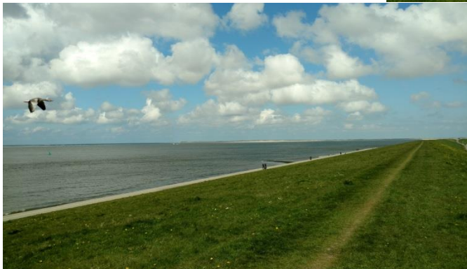
Afbeelding: Uitzicht over de zee en Texel vanaf de Helderse Zeedijk