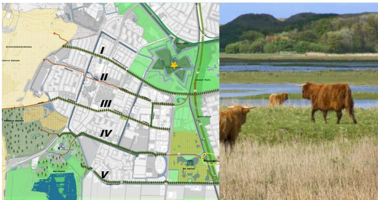
Afbeeldingen: Door de wijk lopen vijf oost-west verbindingen (links) naar het duingebied (rechts)

Naast het toegankelijker maken van de overgangsgebieden tussen wijk en duingebied zetten we in op het doortrekken van het duinlandschap de wijk in. In flinke delen van de wijk is het duinlandschap niet of nauwelijks zichtbaar en voelbaar, terwijl dit grote kansen biedt voor de kwaliteit en de aantrekkingskracht van de wijk. Daarom zetten we erop in om Nieuw Den Helder verder te ontwikkelen tot een wijk die overduidelijk in de duinen ligt. Hierbij focussen we met name op de westrand van de wijk, waar de afstand tot het duingebied klein is en een goede overgang tussen wijk en duingebied goede verbindingen voor de hele wijk oplevert. Door de wijk lopen vijf grote oost-west verbindingen die uitkomen in het duingebied. Langs deze verbindingen zetten we in om het (binnen)duingebied meer de wijk in te laten lopen, door middel van de inrichting van de openbare ruimte en architectuur en materiaalgebruik van gebouwen.