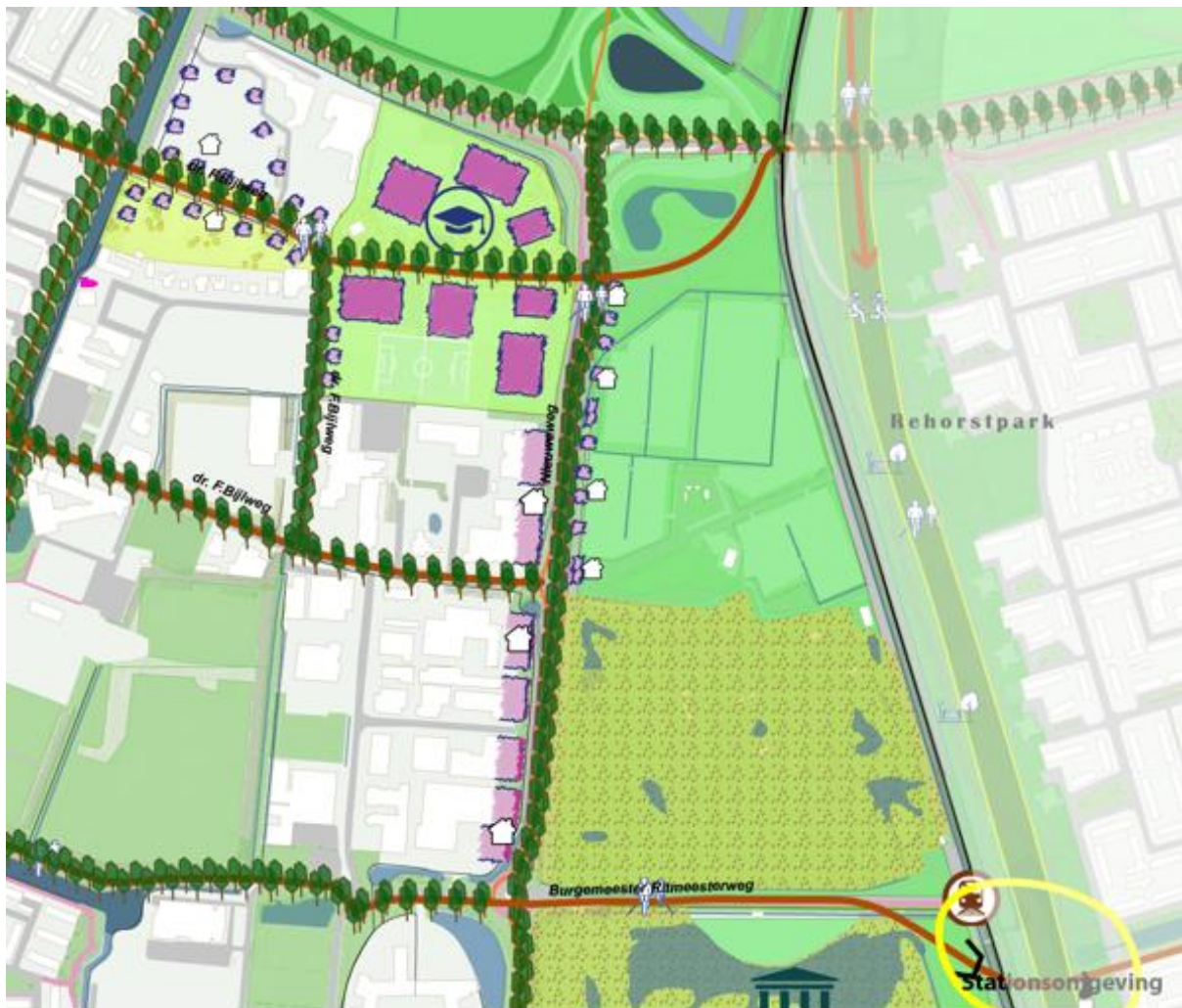
Afbeelding: Impressie van mogelijkheden transformatie Bijlweggebied, versterking entree Nieuw Den Helder via de Nieuweweg en afwaardering van de fly over bij de Waddenzeestraat.

In de rand van het schootsveld van Fort Dirksz Admiraal, tussen de Waddenzeestraat en de Texelstroomlaan, wijzen we een zoekgebied voor ontwikkeling na 2030 aan. Een aantrekkelijke ontwikkeling op deze locatie biedt aanvullende kansen om Nieuw Den Helder meer te verbinden met De Stelling en meer functies toe te voegen langs verbindingssassen tussen de verschillende wijken (Texelstroomlaan en Waddenzeestraat). Een eventuele ontwikkeling dient goed ingepast te worden in de landschappelijke en cultuurhistorische structuur van De Stelling.