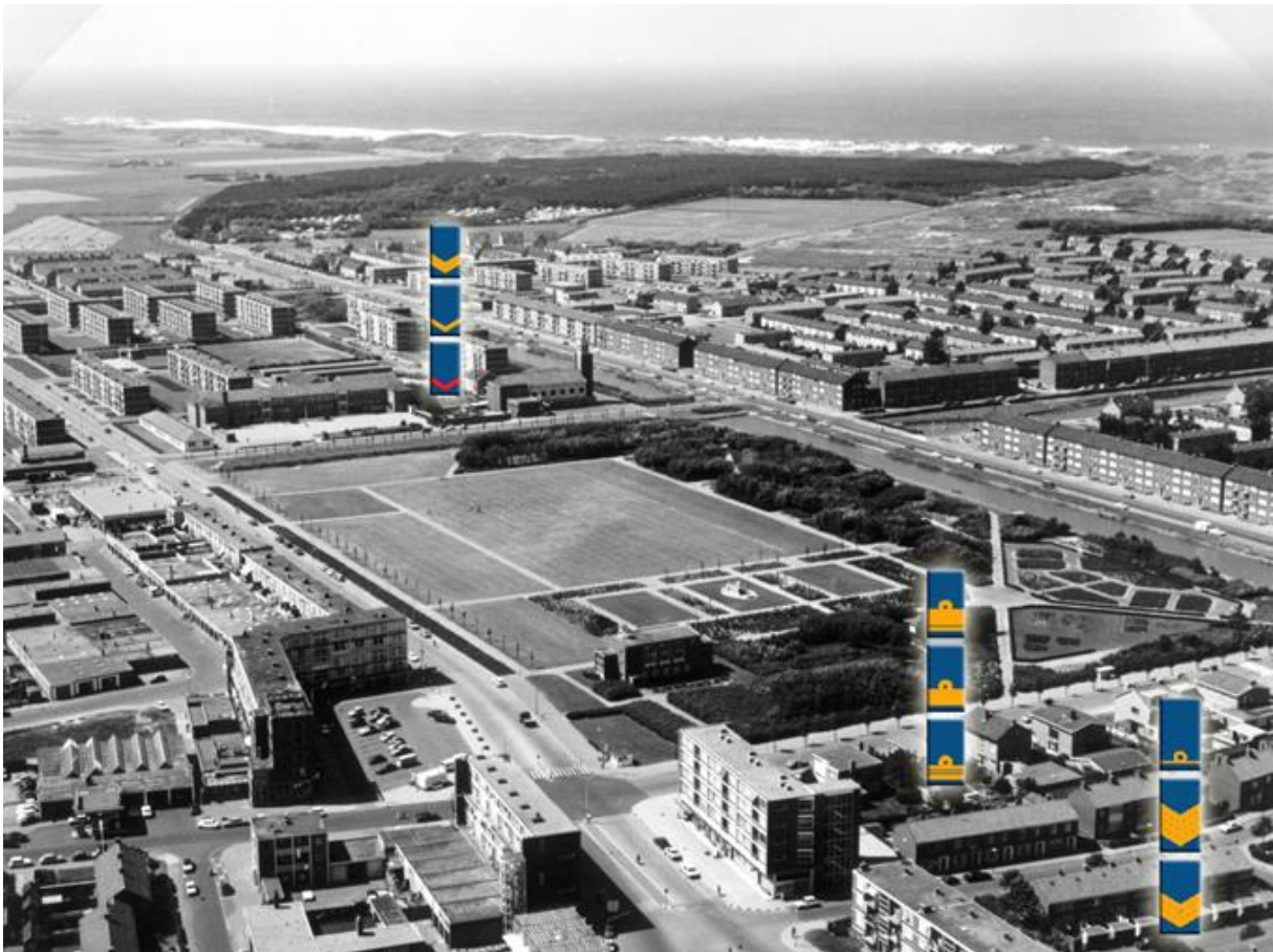
Afbeelding: hiërarchische opbouw van de wijk in de jaren '50, '60 en '70 met verschillende woningtypen bestemd voor verschillende rangen binnen de Koninklijke Marine

De bouw begon in de jaren '50 met de buurt Jeruzalem, zo genoemd in verband met de witte kleur van de betonnen woningen. Na het gedeelte ten westen van de Jan Verfaillweg gerealiseerd te hebben werd in hoog tempo verder gebouwd aan de oostzijde van de Jan Verfaillweg. Kenmerkend aan de wijk is dat de opzet het hiërarchische karakter van het Den Helder van die tijd weerspiegelt, door de dominante positie van de Koninklijke Marine als werkgever. Portiek- en galerijflats waren bestemd voor matrozen en lagere onderofficieren, eengezinswoningen voor hogere onderofficieren en betere eengezinswoningen voor de hogere officieren. Hiermee ontstond een bepaalde segregatie tussen buurten, ondanks dat de wijk als geheel behoorlijk gemengd was. De grote scheidingswegen tussen de buurten versterkten dit effect nog extra.