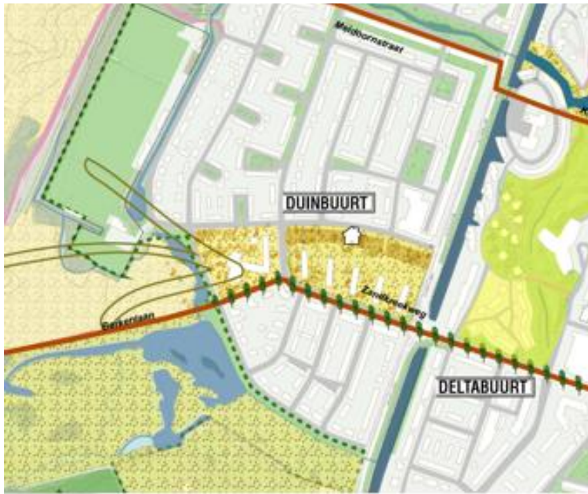
Afbeelding: Impressie van het doortrekken van het duinlandschap langs de Duinroosstraat.

De openbare ruimte tussen de Duinroosstraat/Berkenlaan en de Elzenstraat biedt veel kansen om het duinlandschap verder de wijk in te krijgen. Door de opzet van dit deel van de wijk lopen er veel minder noord-zuid verbindingen dan ten noorden en ten zuiden van dit gebied. Bovendien zorgt de huidige gestapelde bouw voor een grotere hoeveelheid openbare ruimte en langere zichtlijnen. We zoeken mogelijkheden om het duinlandschap zichtbaarder te maken in de openbare ruimte van het gebied en zetten in op een aantrekkelijke verbinding naar het duingebied. Bij toekomstige aanpassingen/transformatie van de opzet van het gebied houden we rekening met deze ambitie en zetten we in op verdere versterking van de landschappelijke verbinding.