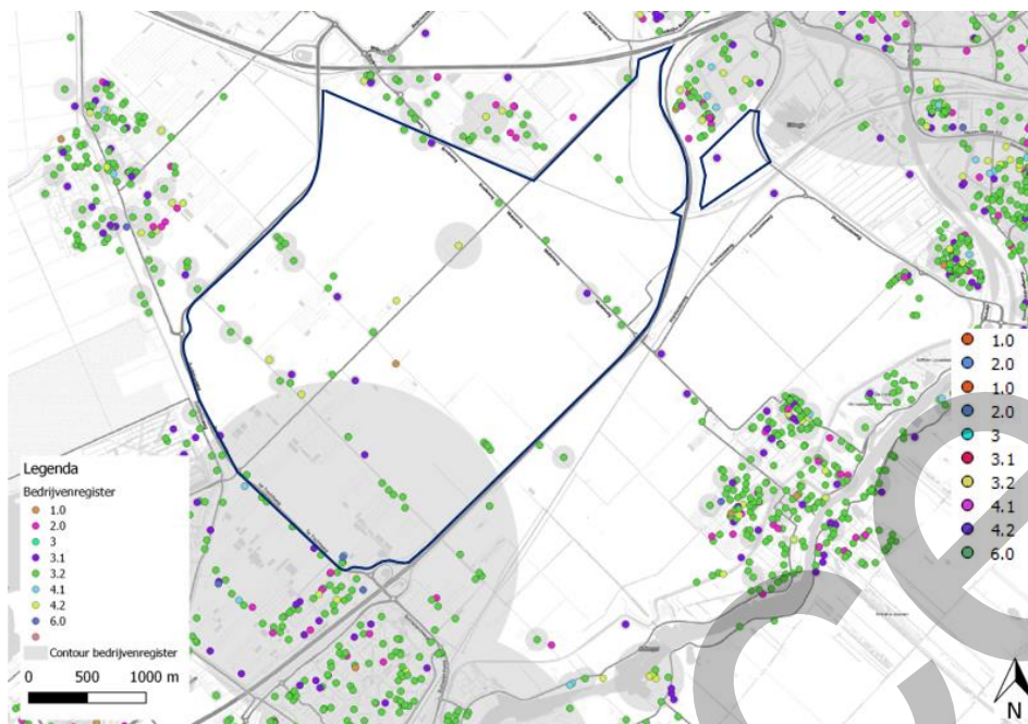
Figuur 3.4 | Bedrijven en milieucategorie ( Bedrijvenregister Provincie Zuid-Holland, 2016 )

Rondom het plangebied liggen verschillende bedrijven met een milieucategorie tot maximaal categorie 6. De contouren van deze bedrijven liggen niet over het deel van het plangebied waar woningbouw of nieuwe bedrijvigheid beoogd is.