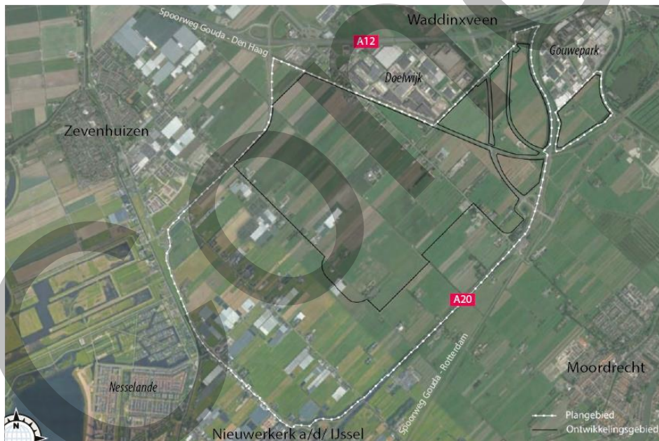
Figuur 1.1 | Plangebied ontwikkeling Middengebied

De gemeente Zuidplas werkt aan de ontwikkeling van het Middengebied. Het gaat om een integrale gebiedsontwikkeling waarin ruimte wordt geboden aan woningen, bedrijvigheid, (maatschappelijke) voorzieningen, infrastructuur en natuur. De kern van de ontwikkeling wordt gevormd door de realisatie van een nieuw dorp van 8.000 woningen. Het plangebied ligt in de oksel van de A12 en de A20, tussen de kernen Nieuwerkerk a/d IJssel, Moordrecht, Zevenhuizen, Waddinxveen en Gouda.