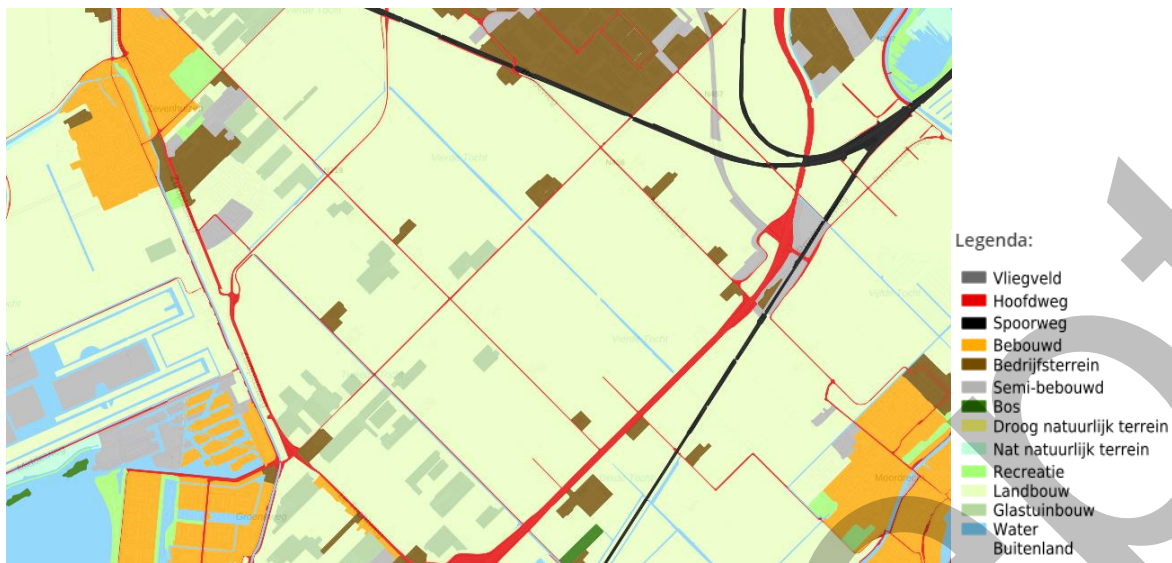
Figuur 3.3 | Bodemgebruik 2015 (CBS)

In de huidige situatie is er in de regio Midden-Holland, waartoe het Middengebied behoort, een grote behoefte aan bedrijventerreinen. Dit volgt uit de 'Behoeferaming bedrijventerreinen Zuid-Holland', uitgevoerd door Stec Groep (de Kort, Beekmans, Stopel, & Lewis, 2021) en vastgesteld door Gedeputeerde Staten van Zuid-Holland. Deze behoefte is niet verder gespecificeerd naar gemeenten, dus het is niet duidelijk hoe groot de behoefte aan bedrijventerrein in de gemeente Zuidplas specifiek is. Het Middengebied heeft gezien de centrale ligging en ontsluitingsmogelijkheden over snel- en N-wegen wel een groot potentieel voor bedrijventerreinontwikkeling. Deze potentie wordt in de huidige situatie niet volledig benut. Daarbij komt dat het Middengebied onderdeel is van de regio Midden-Holland, waar de behoefte aan bedrijventerreinen groot is en het aanbod onvoldoende.