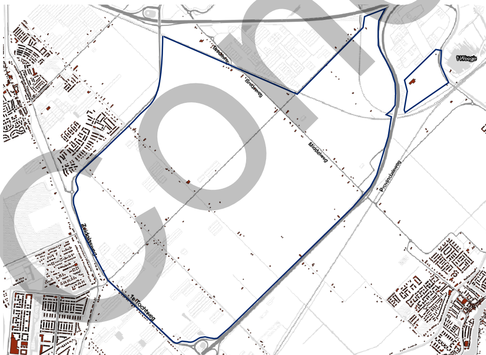
Figuur 3.1 | Woningbouw in de Zuidplaspolder

In de huidige situatie zijn er aantal een clusters aan woningen te vinden binnen het plangebied. Zoals in onderstaande afbeelding (Kadaster, 2018) te zien is, liggen deze voornamelijk langs de 1 e , 2 e en 3 e tocht en langs de Middelweg/Bredeweg. Ook aan de noordkant van de Zuidelijke Dwarsweg staan woningen en boerderijen. Volgens het CBS gaat het langs de Middelweg om ongeveer 150 inwoners in 2018 (CBS vierkantstatistieken, 2021). In de tweede tocht gaat het om ongeveer 300 inwoners. Een groot deel van de woningen is gekoppeld aan een bedrijfsbestemming, hoofdzakelijk agrarisch en kassen.