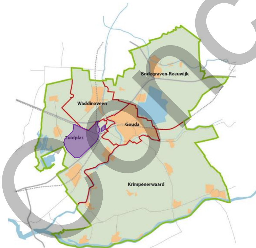
Figuur 4.1 | Regio Midden-Holland en het Middengebied (paars).

In het basisalternatief wordt de bouw van in totaal 8.000 woningen mogelijk gemaakt. De eerste 4.260 woningen worden tot 2031 gebouwd in Fase 1. In Fase 2 worden de laatste 3.740 woningen gebouwd tot 2040. Effectief betekent dit dat het basisalternatief tot 2031 voor 29,4% voorziet in de woningbouwbehoefte van 14.500 woningen in de regio. Dit is, gezien het relatief kleine oppervlakte van het Middengebied ten opzichte van het oppervlakte van regio Midden-Holland, zeer veel (zie figuur 4.1).