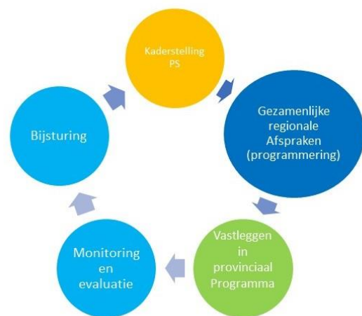
Regionale programmering is een continue proces

Voor 'werken' wordt de regionale programmering (vooralsnog) beperkt tot bedrijventerrein. Daarbij gaat het niet uitsluitend over nieuw bedrijventerrein, maar kan het ook gaan over herstructurering, verduurzaming en/of intensivering van bestaande terreinen. Als partijen dat wensen en er mee instemmen, kunnen aanvullend ook afspraken worden gemaakt over andere werklocaties.