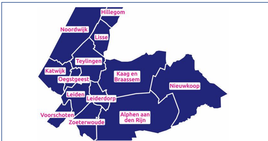
Figuur 1 deelnemende gemeenten in RES-regio Holland Rijnland

Het plangebied betreft het gehele grondgebied van het samenwerkingsverband Holland Rijnland. Dit zijn de gemeenten: Alphen aan den Rijn, Hillegom, Kaag en Braassem, Katwijk, Leiden, Leiderdorp, Lisse, Nieuwkoop, Noordwijk, Oegstgeest, Teylingen, Voorschoten en Zoeterwoude.