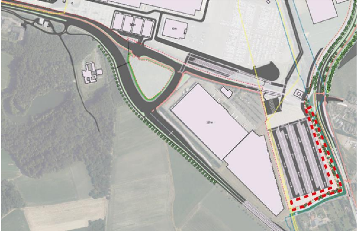
Figuur 1.12: locatie inpassing rondom traileryard (rood omlijnd)