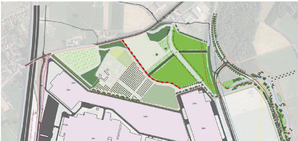
Figuur 1.6: locatie beplanting Jonkheer G. Ruijs de Beerenbroucklaan (rode lijn)