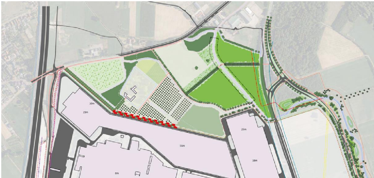
Figuur 1.5: locatie en invulling struweelrand (rood omlijnd)