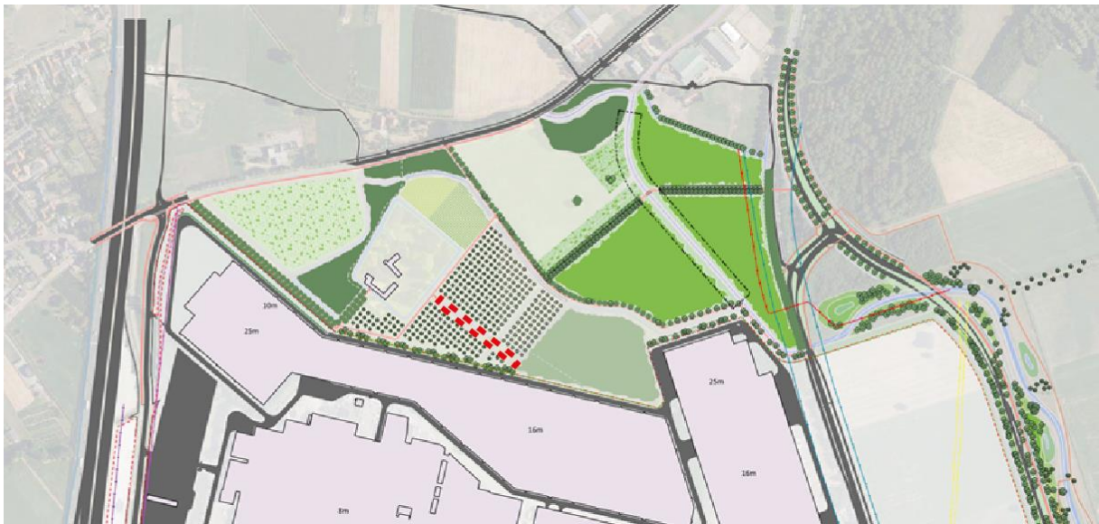
Figuur 1.4: locatie Grand Canal(rood omlijnd)