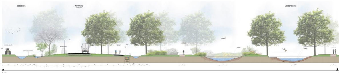
Figuur 1.8: profiel VDL Nedcar – randweg – Geleenbeek - Nieuwstadt