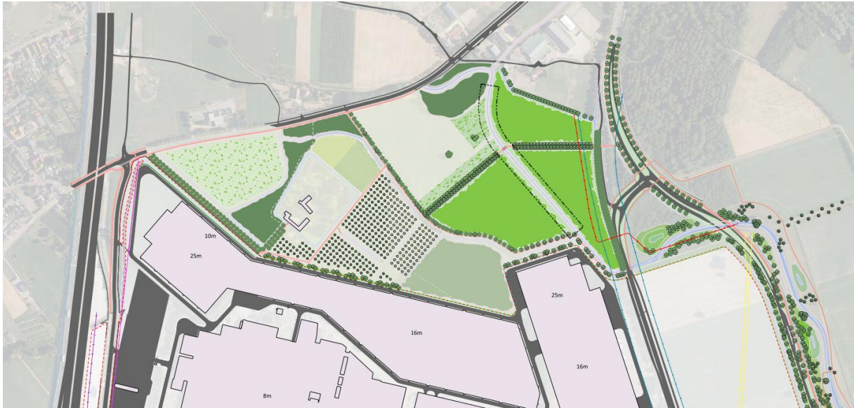
Figuur 1.1: totaal overzicht landschappelijke maatregelen noordzijde