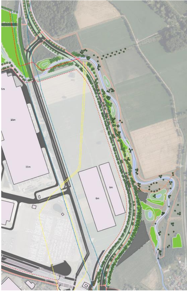
Figuur 1.7: totaal overzicht landschappelijke maatregelen oostzijde