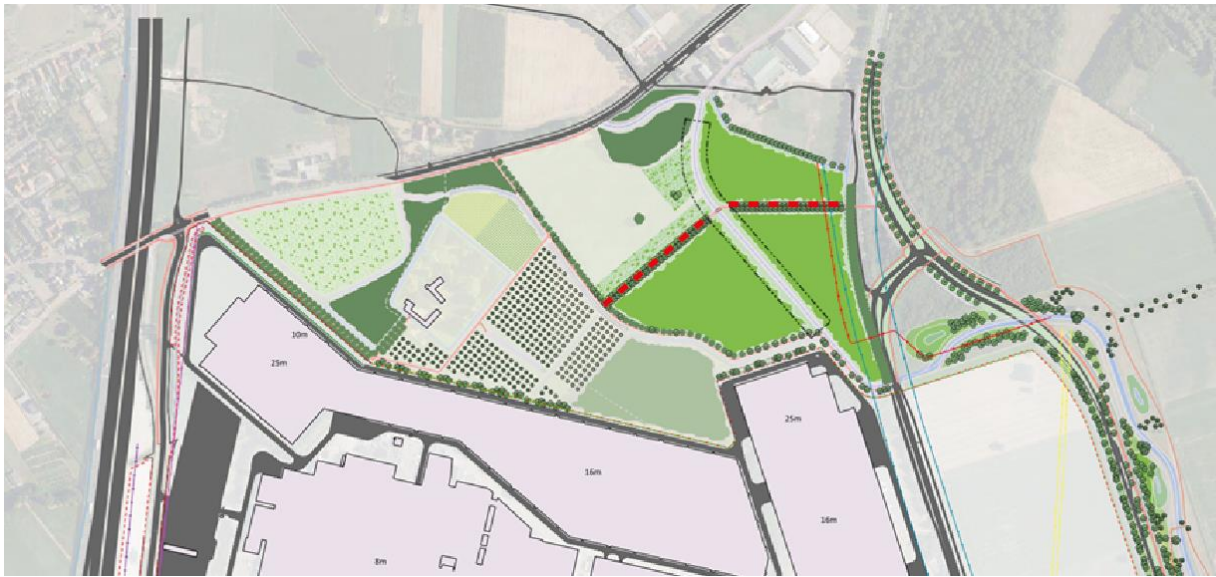
Figuur 1.3: locaties lindelaan (rode lijn)