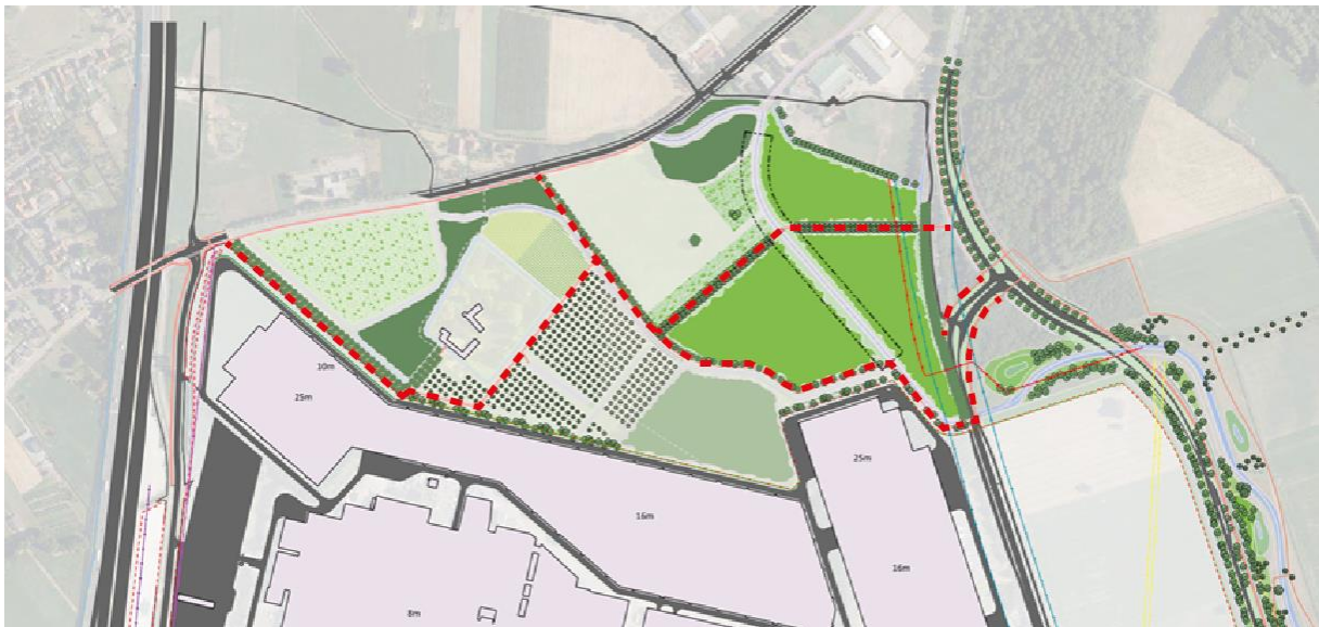
Figuur 1.2: locaties fietspad (rode lijn)