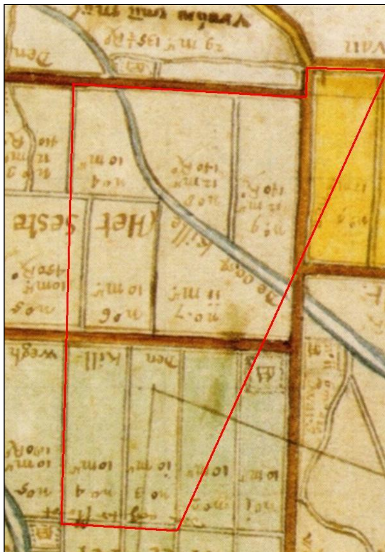
Plangebied Amstelwijck op een kaart van de Polder Wieldrecht uit 1660 (M. van Nispen 1703)

Deze polderwegen worden doorsneden door de spoorlijn, de Rondweg N3 en de snelweg A16, waardoor zij hun oorspronkelijke functie voor een groot deel hebben verloren. Van zuidoost naar noordwest stroomt nog altijd de Oostkil door het noorddeel van het plangebied. Op de oostrand van het plangebied heeft voor een deel de grote buitenplaats Groenhove gelegen. De bijbehorende gronden reikten van Kilweg tot Zeedijk. Deze grote buitenplaats werd al rond 1660 gebouwd rond en is na 1782 gesloopt. Het rechthoekige slotenpatroon van de uitgebreide siertuin met bijbehoren is nog deels in het landschap aanwezig en herkenbaar. De heul naar Groenhove is ook nog aanwezig en laat het jaartal 1782 zien. De buitenplaats wordt doorkruist door de spoorlijn en de Rondweg. In 2009 wordt de locatie van het hoofgebouw van Groenhove, gelegen tussen spoor en snelweg, archeologisch onderzocht.