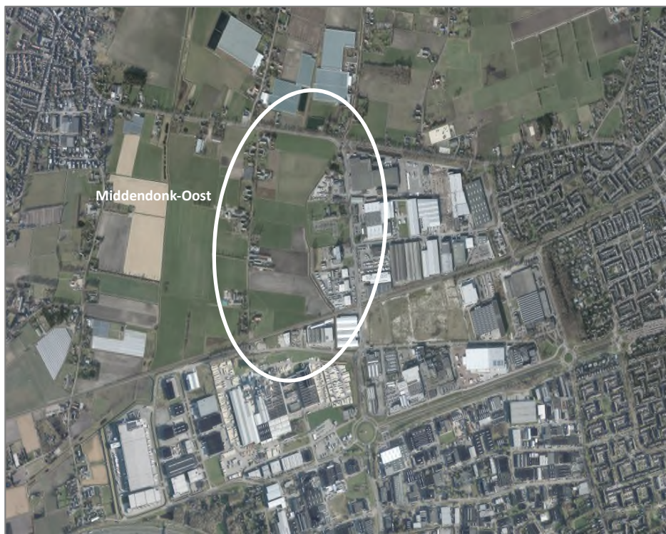
Figuur: ligging Middendonk-Oost

In regionaal verband zijn in het ‘Afsprakenkader evenwicht bedrijventerreinenmarkt West-Brabant 2016-2026’ afspraken vastgelegd over de ontwikkeling van bedrijventerreinen. Er is in West-Brabant sprake van een kwantitatieve en kwalitatieve disbalans in het aanbod van bedrijventerreinen: een overaanbod aan bedrijventerrein voor lokaal gebonden midden- en kleinbedrijven en industrie, en een tekort aan terreinen voor (grootschalige) logistiek. Vanwege de (sub)regionale logistieke vraag is in de gemeente Etten-Leur sprake van een ruimtevrage van circa 10 hectare, die niet binnen het bestaand stedelijk gebied kan worden opgevangen. Uitbreiding is nodig om in de vraag te kunnen voorzien.