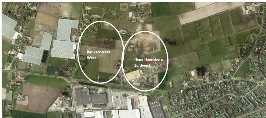
Figuur: ligging Bankenstraat-West en Hoge Haansberg Zuidwest

Voor de uitbreiding zijn drie locaties aan de noordzijde van het bedrijventerrein Vosdonk in beeld: Middendonk-Oost, Bankenstraat-West en Hoge Haansberg-Zuidwest. Deze gebieden liggen in het zoekgebied verstedelijking. De gronden ten zuiden van de rijksweg aansluitend op afslag 19 liggen niet meer in dit zoekgebied. In de MER wordt deze locatie niet meegenomen. Dat geldt ook voor de gronden nabij afslag 18 (omgeving Hulsebaan-Bollenstraat). Deze locatie ligt op afstand van het bestaande bedrijventerrein, bundeling van bedrijfsactiviteiten heeft de voorkeur. In het MER richten we niet slechts op (grootschalige) logistiek. Eventueel nieuw bedrijventerrein wordt ook beschouwd als optie voor verplaatsing van gevestigde bedrijven, om zodoende transformatie en verduurzaming van bestaande bedrijventerreinen mogelijk te maken. Zeker nu blijkt dat het aandeel logistiek op bestaand bedrijventerrein toeneemt.