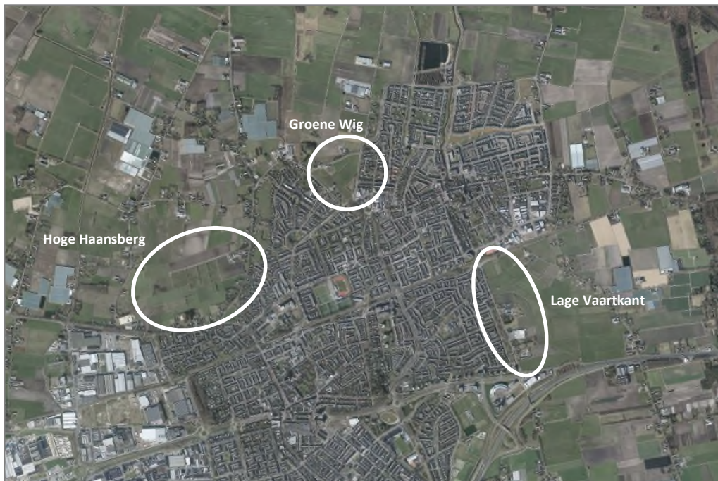
Figuur: potentiële uitbreidingslocaties voor woningbouw