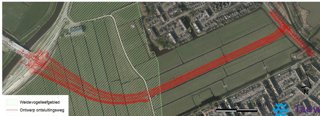
Figuur 2. Ontwerp derde ontsluitingsweg ten opzichte van weidevogelleefgebied (Provincie Noord-Holland, 2018)

Ongeveer de helft van het beoogde tracé ligt in weidevogelleefgebied (zie figuur 2). Dit betekent dat de Provinciale Ruimtelijke Verordening, onderdeel weidevogelleefgebieden, van kracht is.