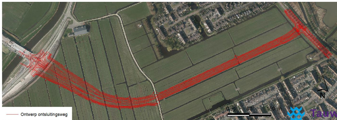
Figuur 1 Ontwerp derde ontsluitingsweg

De gemeente Edam-Volendam is voornemens een derde ontsluitingsweg te realiseren (zie figuur 1). In opdracht van de gemeente Edam-Volendam heeft Tauw een concept MilieueffectRapport (MER) opgesteld (kenmerk R001-1226747HUU-V01, d.d. 10 oktober 2016, dit MER is nog niet definitief en nog niet vastgesteld). Eén van de conclusies uit het onderdeel natuur was dat het tracé door weidevogelleefgebied loopt. In de provincie Noord-Holland is de bescherming van weidevogelleefgebieden geborgd in de Provinciale Ruimtelijke Verordening. Verlies aan fysiek weidevogelleefgebied dient gecompenseerd te worden conform de Uitvoeringsregeling natuurcompensatie Noord-Holland (Provincie Noord-Holland, 2014).