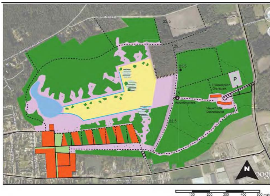
Figuur 1.1 Overzicht plangebied (alle ingekleurde delen) uit Masterplan Groeve Boudewijn van Welmers Burg Stedenbouw uit januari 2010.

Op dit moment is de groeve gesloten en is er sprake van opslag van pioniersvegetaties. Het plan van Vestia voorziet in het herstel van landschappelijke waarden, natuurontwikkeling en een deel woningbouw, waardoor een nieuwe bebouwingschil aan de kern van Ossendrecht wordt toegevoegd. Het betreft 75 grondgebonden woningen. De vennen in het gebied blijven behouden. Het plangebied is gelegen in een grondwaterbeschermingsgebied wat onderdeel vormt van de drinkwaterwinning Huybergen.