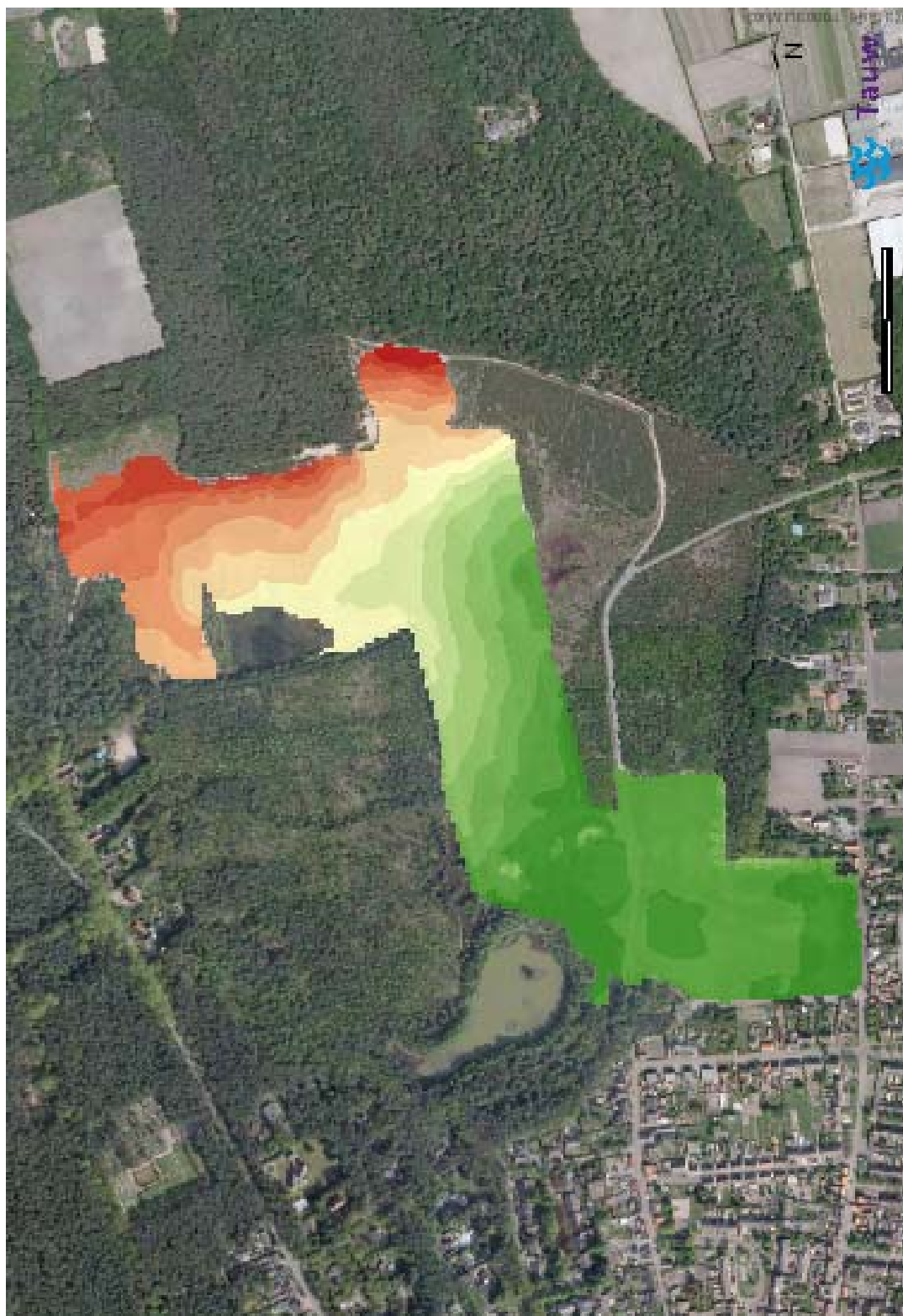
Hoogtekaart, interpolatie van metingen van Van Steenis (laagste punt 10,9 – hoogste punt 24,5 m + NAP)