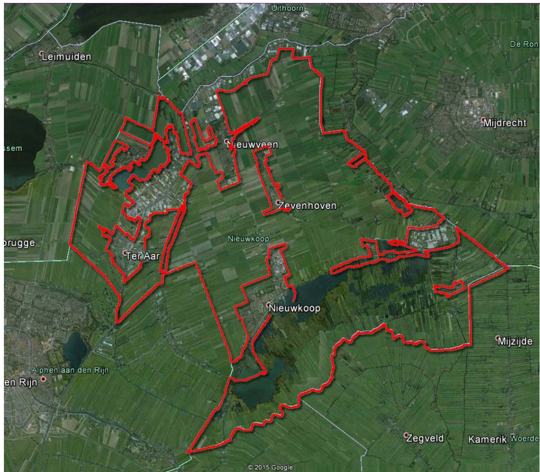
Figuur 2.1 Plangebied bestemmingsplan Nieuwkoop

In het plangebied ligt het Natura 2000-gebied 'Nieuwkoopse Plassen en de Haeck'. In de omgeving liggen de gebieden 'Broekvelden, Vettenbroek & Polder Stein' (zuid), 'De Wilck' (west), 'Botshol' (noord) en 'Oostelijke Vechtplassen' (oost).