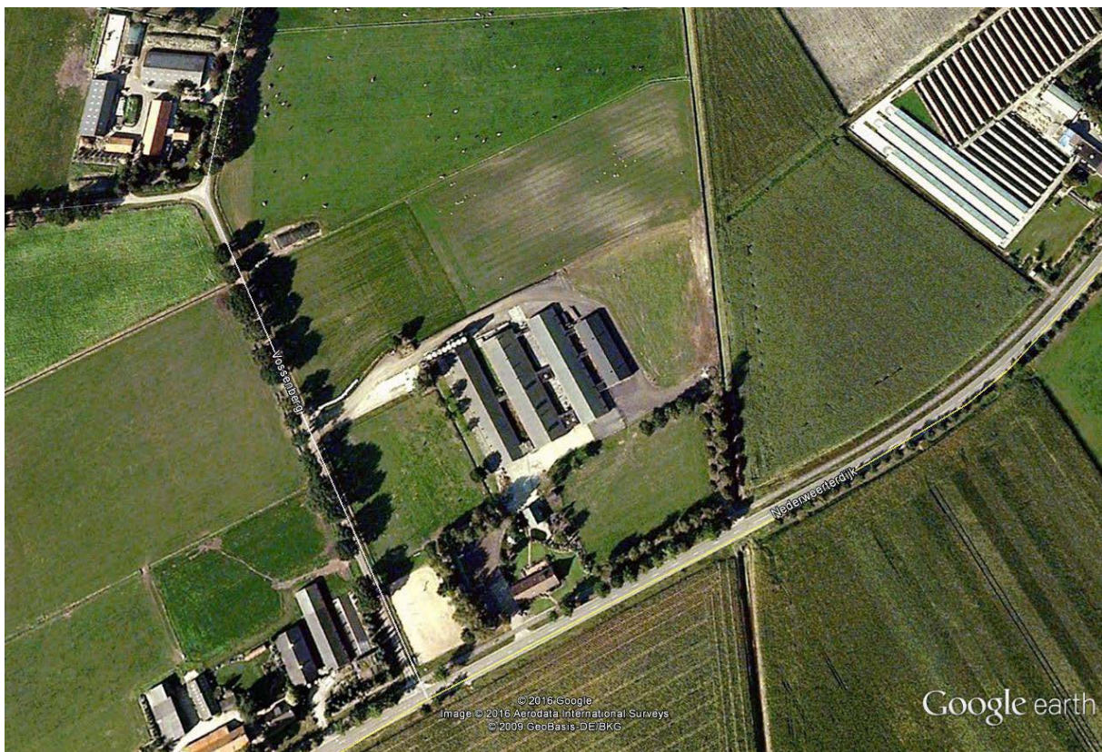
Figuur 1. Plangebied (google earth)

email: advies@archaeo.nl website: www.archaeo.nl