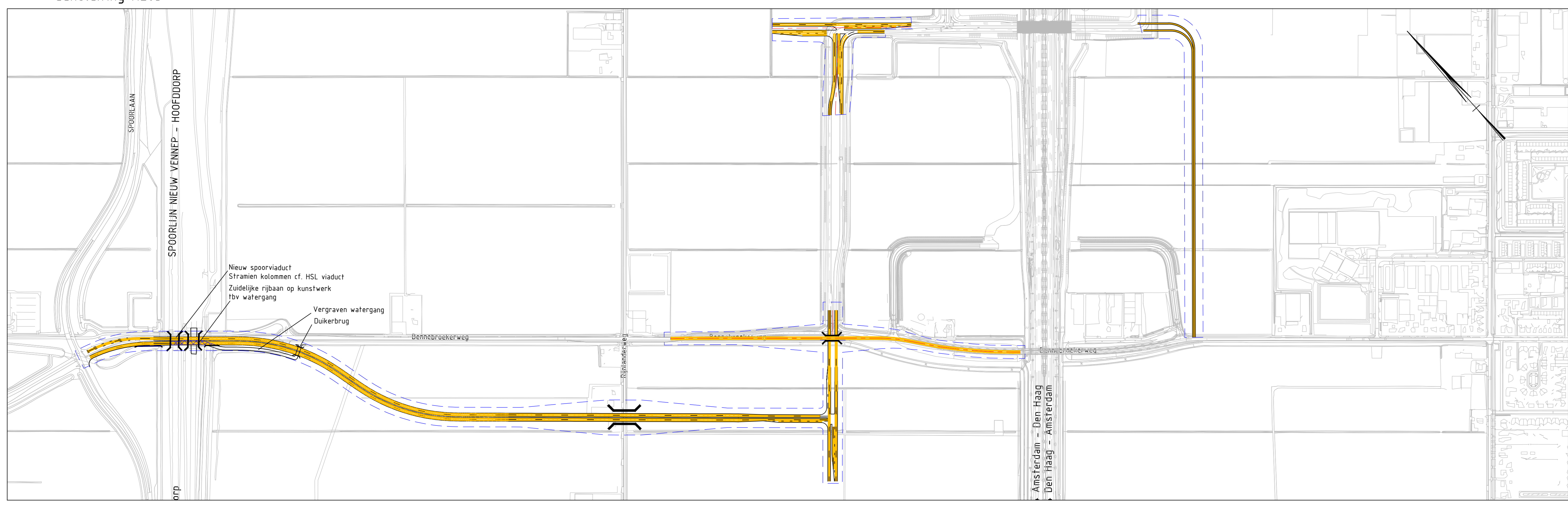
2. Verbreding van de Bennebroekerweg tussen de Hoofdvaart/spoorlaan en de A4