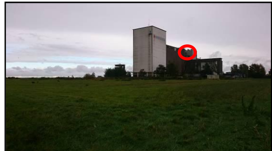
Afbeelding 5 : Zwermplaats gewone dwergvleermuis