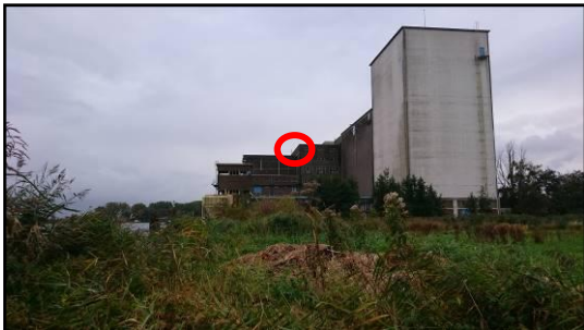
Afbeelding 4: Zwermplaats gewone dwergvleermuis