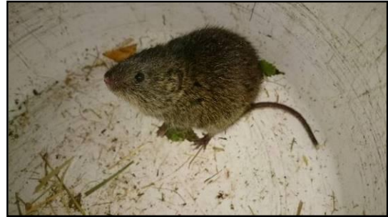
Afbeelding 2: Noordse woelmuis