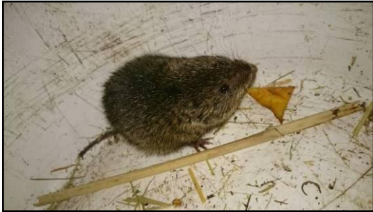
Afbeelding 1: Noordse woelmuis