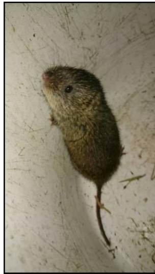
Afbeelding 3: Noordse woelmuis