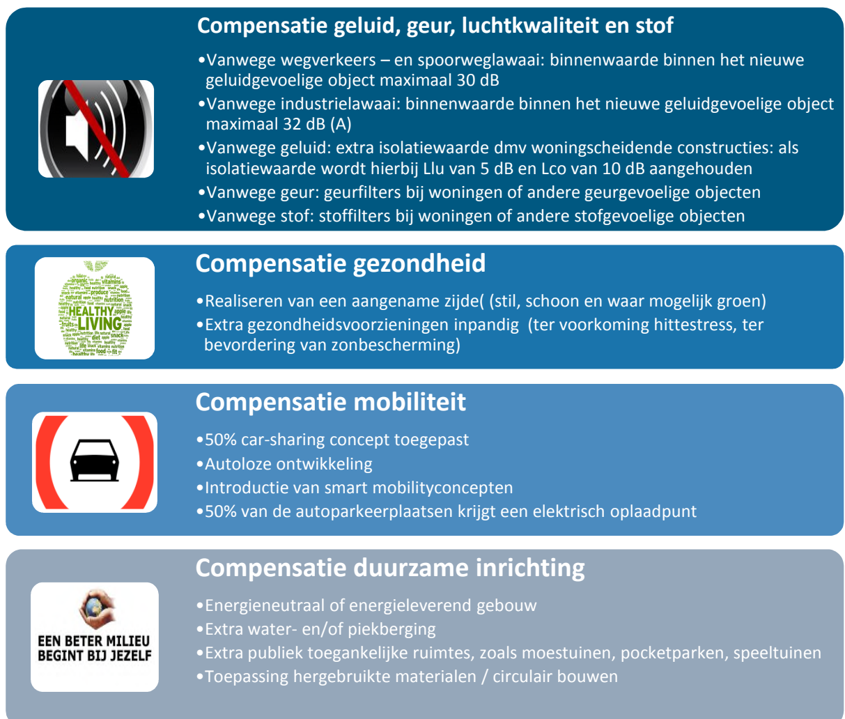
figuur 1-1 Niet-limitatieve lijst van compenserende maatregelen

Zoals aangegeven geldt geen classificatie van de maatregelen. Dus compenserende maatregelen voor duurzaamheid zijn niet beter dan compenserende maatregelen op het gebied van mobiliteit. Wel geldt specifiek voor het thema geluid, dat wel als eerste maatregelen getroffen moeten worden die ook onder dat thema vallen, zie ook figuur 6-1.