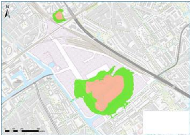
Geluidsbelasting gezoneerde industrieterrein De Binckhorst

Uit het onderzoek in het OER bleek dat de ambities van De Binckhorst niet zijn te realiseren binnen de milieurandvoorwaarden. Met name de milieuaspecten geluid, lucht, externe veiligheid en geur knelden met de ambities van gemengde stedelijke ontwikkeling. In het MER is daarom onderzoek gedaan naar alternatieven waarmee deze knelpunten kunnen worden opgelost.