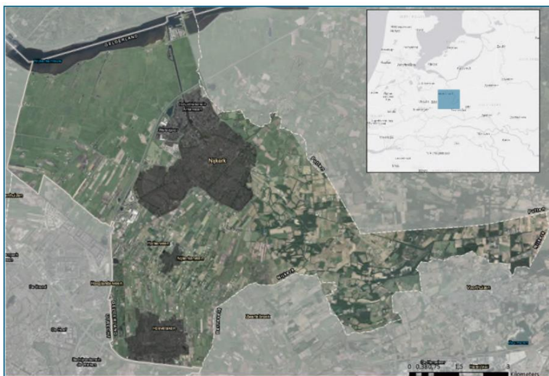
Figuur 1 Luchtfoto gemeente Nijkerk