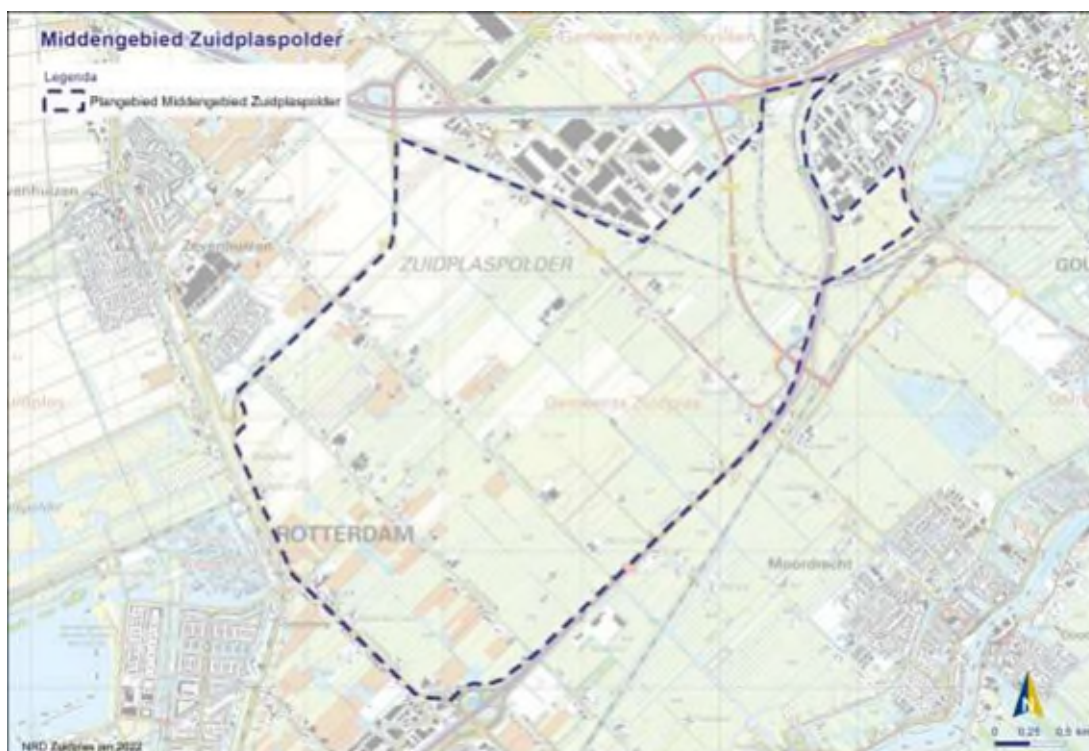
Figuur 1: kaart Middengebied (bron: MER).

Met het oog hierop beveelt de Commissie aan om in dialoog te blijven met de gemeente (en andere betrokken partijen) en in dit proces waar mogelijk meer inhoudelijke richtlijnen en bouwstenen mee te geven. Denk daarbij aan het afstemmen van keuzes ten aanzien van een waterveilig peil bij realiseren van (provinciale) infrastructuur en woonbebouwing, normering voor evacuatie en invulling van de robuuste ecologische verbinding/Groene Schakel inclusief het gebied met de aanduiding 'maatwerk glastuinbouw'. 2