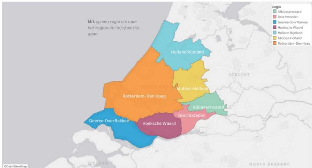
Figuur 1: de zeven RES-regio's in Zuid-Holland.