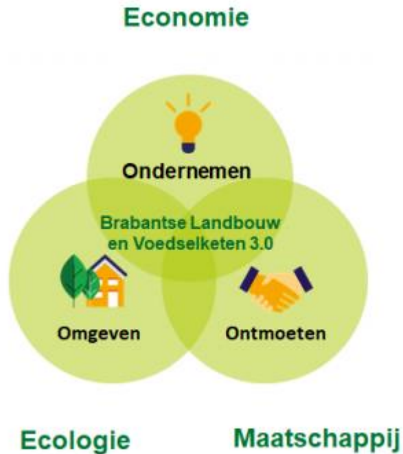
Figuur 1: Samenhang tussen Economie, Ecologie en Maatschappij (bron: NRD, pag. 20).