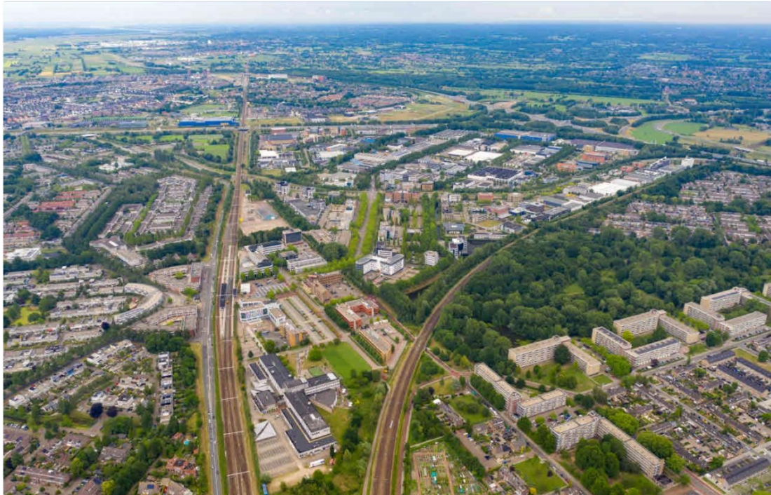
Figuur 1 Luchtfoto van De Hoef-West in Amersfoort.