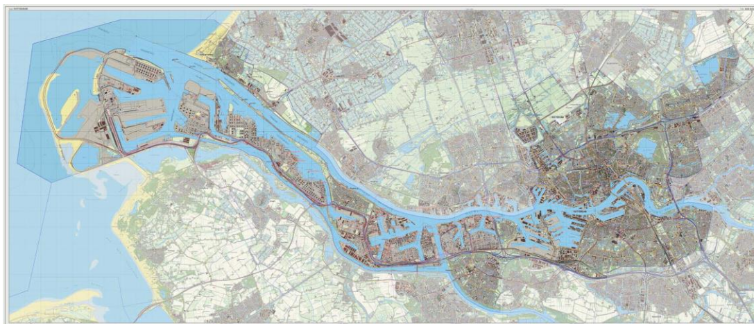
Figuur 1: topografie gemeente Rotterdam

In de volgende hoofdstukken beschrijft de Commissie in meer detail welke informatie het ROER moet bevatten. De Commissie bouwt in haar advies voort op de NRD 2 . Dat wil zeggen dat ze in dit advies niet ingaat op de punten die naar haar mening in de NRD voldoende aan de orde komen.