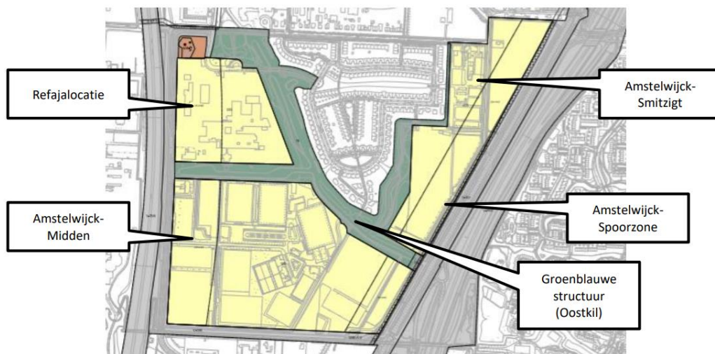
Figuur 2 – Wijken in Amstelwijk (bron: verbeelding concept ontwerp bestemmingsplan Amstelwijk 2020).