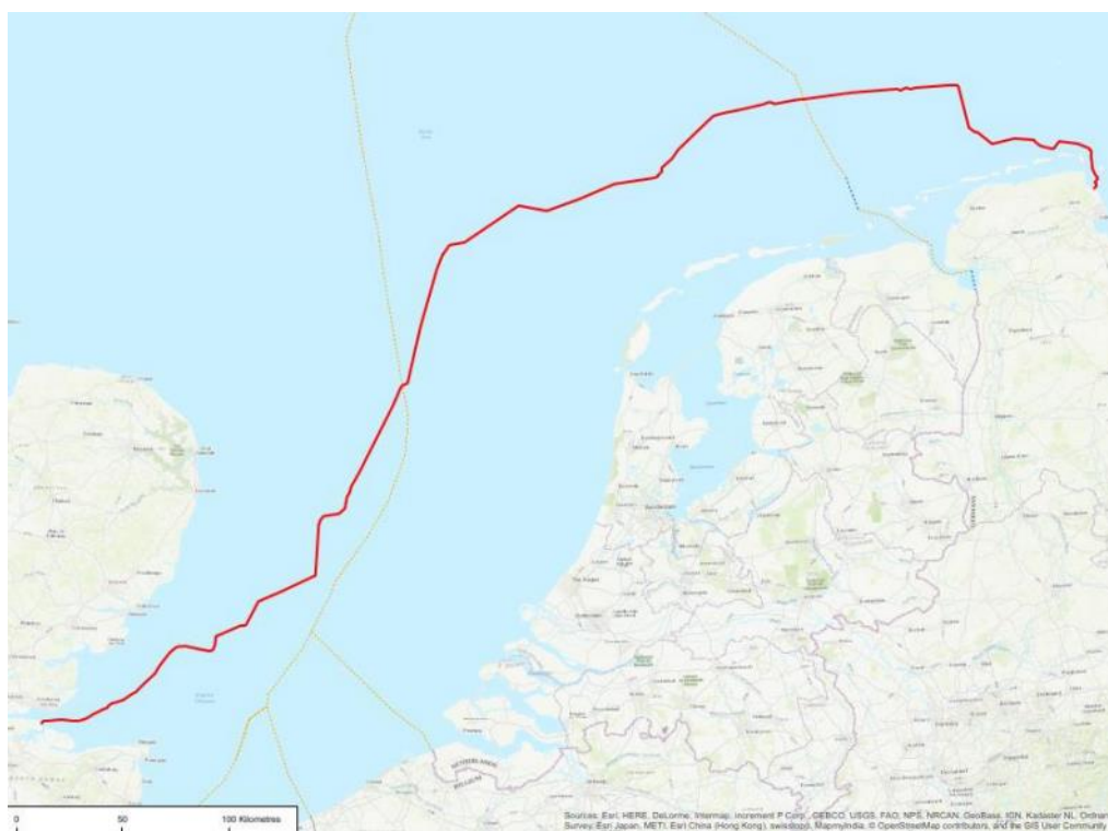
Figuur 1 Een mogelijke route voor de NeuConnect Hoogspanningsverbinding. In groen de grenzen van de Exclusief Economische zones.