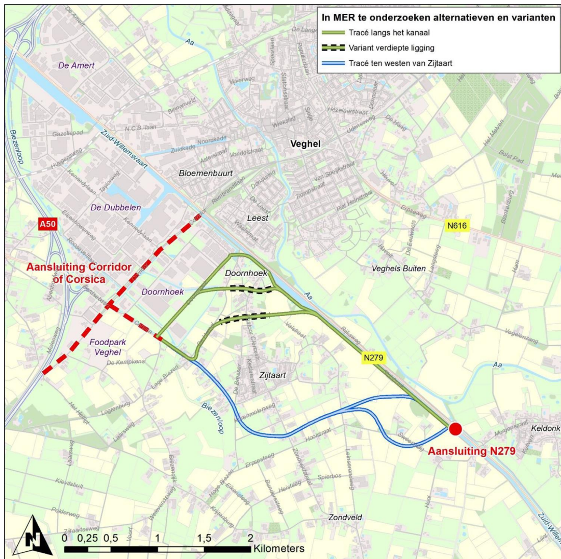
Figuur 1: In het MER te onderzoeken alternatieven (bron: notitie R&D, pagina 20)

Door de uitspraak kan de Passende beoordeling behorende bij de PAS niet meer als toestemmingsbasis dienen voor plannen en projecten. En daarom moet mogelijk ook voor dit plan/project een eigen Passende beoordeling worden opgesteld. Het is aan het bevoegd gezag om binnen de kaders van de natuurbeschermingsregelgeving tot een adequate oplossing te komen. De Commissie gaat hier in paragraaf 4.1 van dit advies verder op in.