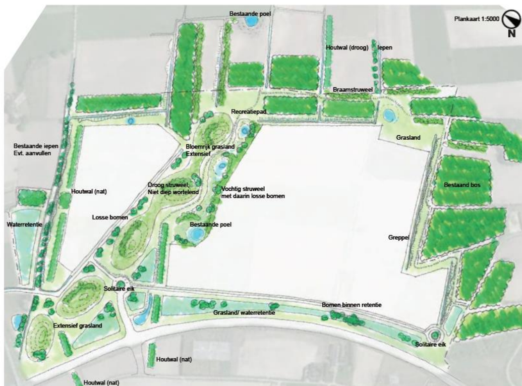
Plangebied Zwaluwenbunders met inpassing Ecologische VerbindingsZone, gemeente Tilburg

van de EVZ, en daarin ook te betrekken in hoeverre de bestemming van de groenzone de realisatiekansen van de provinciale EVZ beïnvloedt.