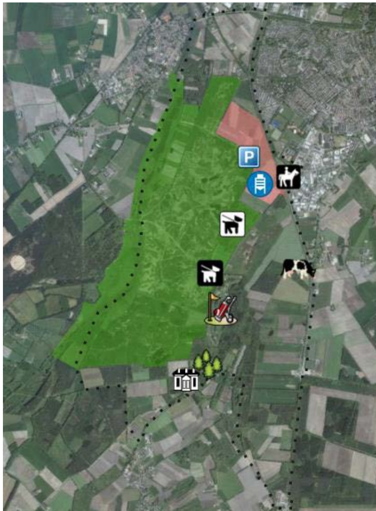
Figuur 1: Overzicht van de verschillende functies, de begrenzing van het plangebied (gestippelde lijn), het Natura 2000-gebied (groene arcering) en het Fokmast-gebied (lichtrode arcering) 4

In de volgende hoofdstukken beschrijft de Commissie in meer detail welke informatie het MER moet bevatten. De Commissie bouwt in haar advies voort op de notitie reikwijdte en detailniveau 3 (verder 'NRD'). Dat wil zeggen dat ze in dit advies niet ingaat op de punten die naar haar mening in de NRD voldoende aan bod komen.