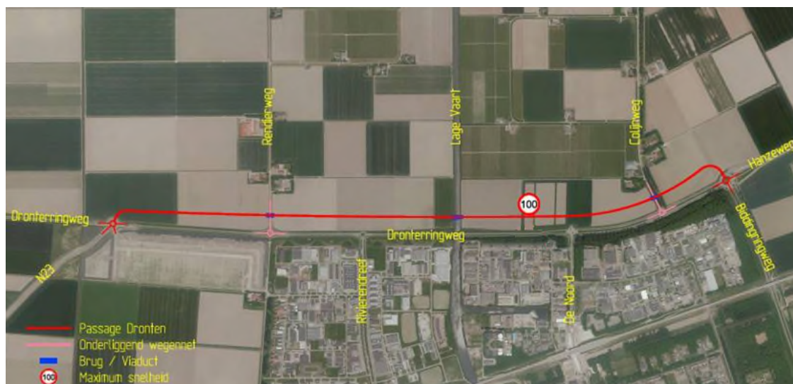
Figuur 3.1: Ligging van het voorkeursalternatief N307 Passage Dronten

In dit hoofdstuk wordt de opwaardering van de N307 ter hoogte van Dronten beschouwd op het aspect externe veiligheid. De ligging van het voorkeursalternatief is weergegeven in figuur 3.1.