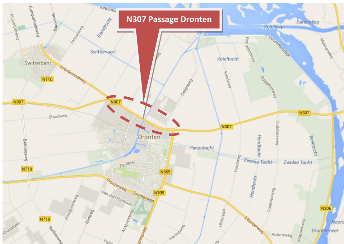
Figuur 1.1: Globale ligging van het plangebied (rode omlijning)

De globale ligging van het op te waarderen tracédeel is weergegeven in figuur 1.1.