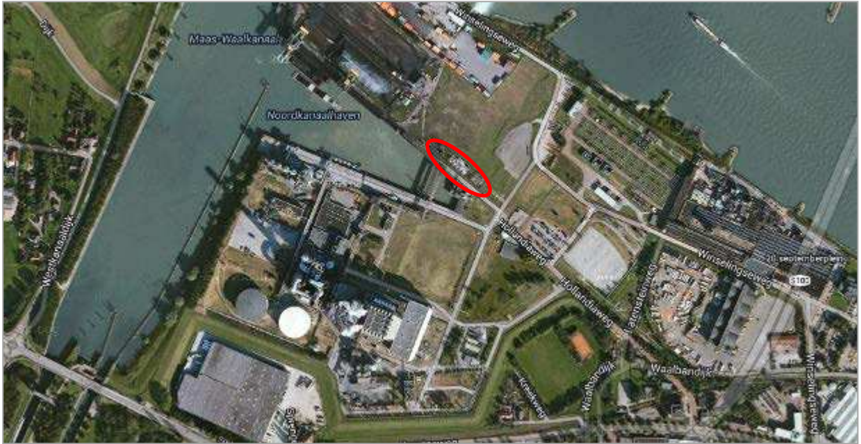
Afbeelding 1. Ligging van de kelders (rood omlijnd) op het terrein van de Centrale Gelderland.