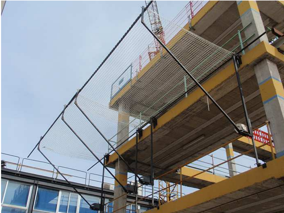
Afbeelding 6: Voorbeeld van een mogelijke vangnetconstructie.

Er kan gedacht worden aan het metselen van een klein muurtje rondom de openingen. Tegen de muurtjes kunnen amfibiewerende schermen geplaatst worden. Kleine dieren krijgen zo nauwelijks de kans om de kelderopening te bereiken. Voor grotere dieren is dit nog wel mogelijk, zij kunnen over het muurtje heen klimmen. Om te voorkomen dat deze dieren in de kelders vallen, kan een vangnetconstructie in de kelderopening worden geplaatst. Door een zeer fijnmazig net (schuin omhoog wijzend) rondom de openingen te plaatsen, wordt voorkomen dat er dieren in de kelders vallen. Een voorbeeld van een dergelijke constructie is gegeven in afbeelding 6. Als materiaal kan gedacht worden aan het net dat in de centrale zelf ook gebruikt wordt om vallend puin op te vangen. Het is van belang dat niet de gehele kelders wordt afgesloten, daar anders de vleermuizen en boerenzwaluwen opgesloten raken. Door met behulp van enkele beugels een soort "wigwam-constructie" in de kelderopening te plaatsen, worden valslachtoffers voorkomen en kunnen vleermuizen en boerenzwaluwen nog de kelders bereiken en verlaten.