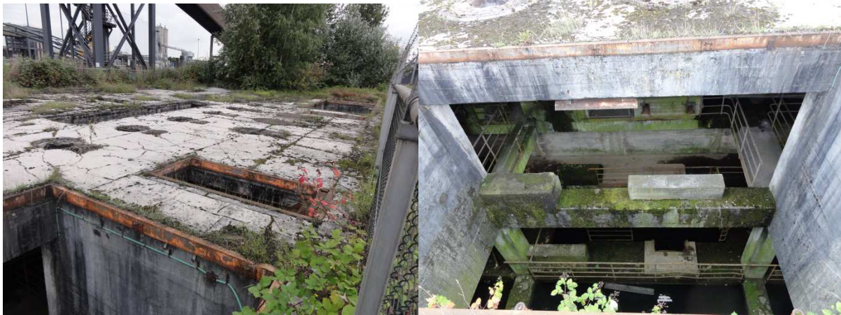
Figuur 3.3. Kelder 2 heeft aan het oppervlak meerdere openingen en heeft alleen op de bodem water staan.