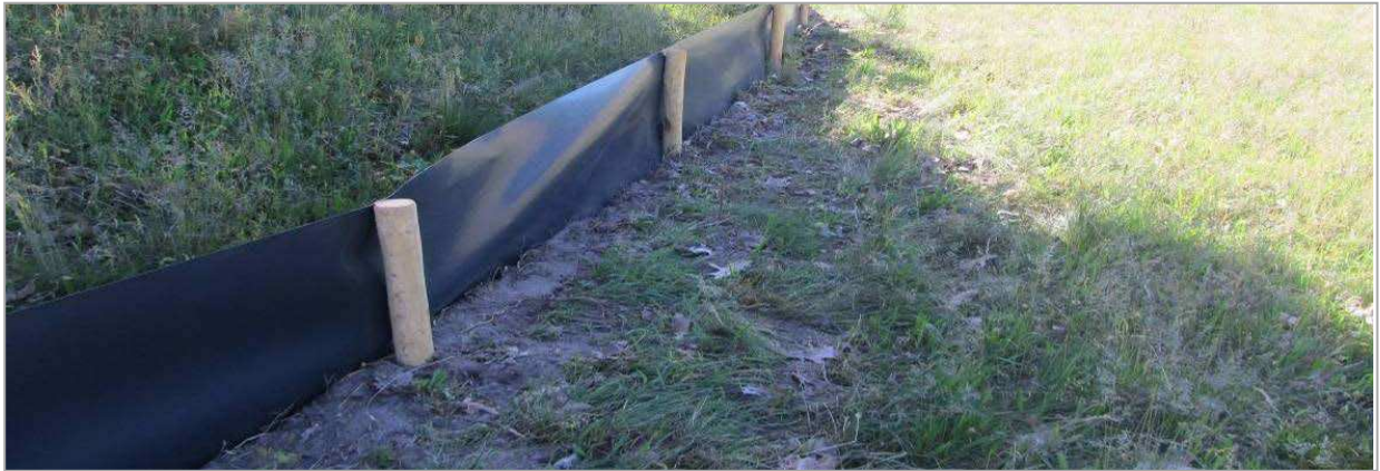
Afbeelding 3: Voorbeeld van een amfibiewerend scherm (binnenzijde). Door het gladde oppervlak zijn reptielen, amfibieën en kleine zoogdieren niet in staat om tegen het scherm op te kruipen.

Binnen het plangebied zijn meerdere kelders aanwezig. Voor de verschillende kelders zijn verschillende oplossingsrichtingen mogelijk. Als eerste kan er aan worden gedacht om het gehele kelderterrein ontoegankelijk te maken voor reptielen, amfibieën en kleine zoogdieren. Dit kan bereikt worden door het plaatsen van amfibiewerende schermen. Dit zijn kunststof schermen die aan de onderzijde van het reeds bestaande hekwerk geplaatst kunnen worden. Hiermee wordt voorkomen dat amfibieën, reptielen en kleine zoogdieren het terrein op kunnen komen en mogelijk in de kelders vallen. In onderstaande afbeelding is een voorbeeld van een amfibiewerend scherm gegeven. Aandachtspunten bij het plaatsen van amfibieënschermen zijn de locaties van de bevestigingspaaltjes (deze dienen aan de binnenzijde (kelderzijde) van het scherm te staan) en het onderhoud. Er moet voorkomen worden dat amfibieën, reptielen en kleine zoogdieren via de begroeiing over het scherm kunnen klimmen.