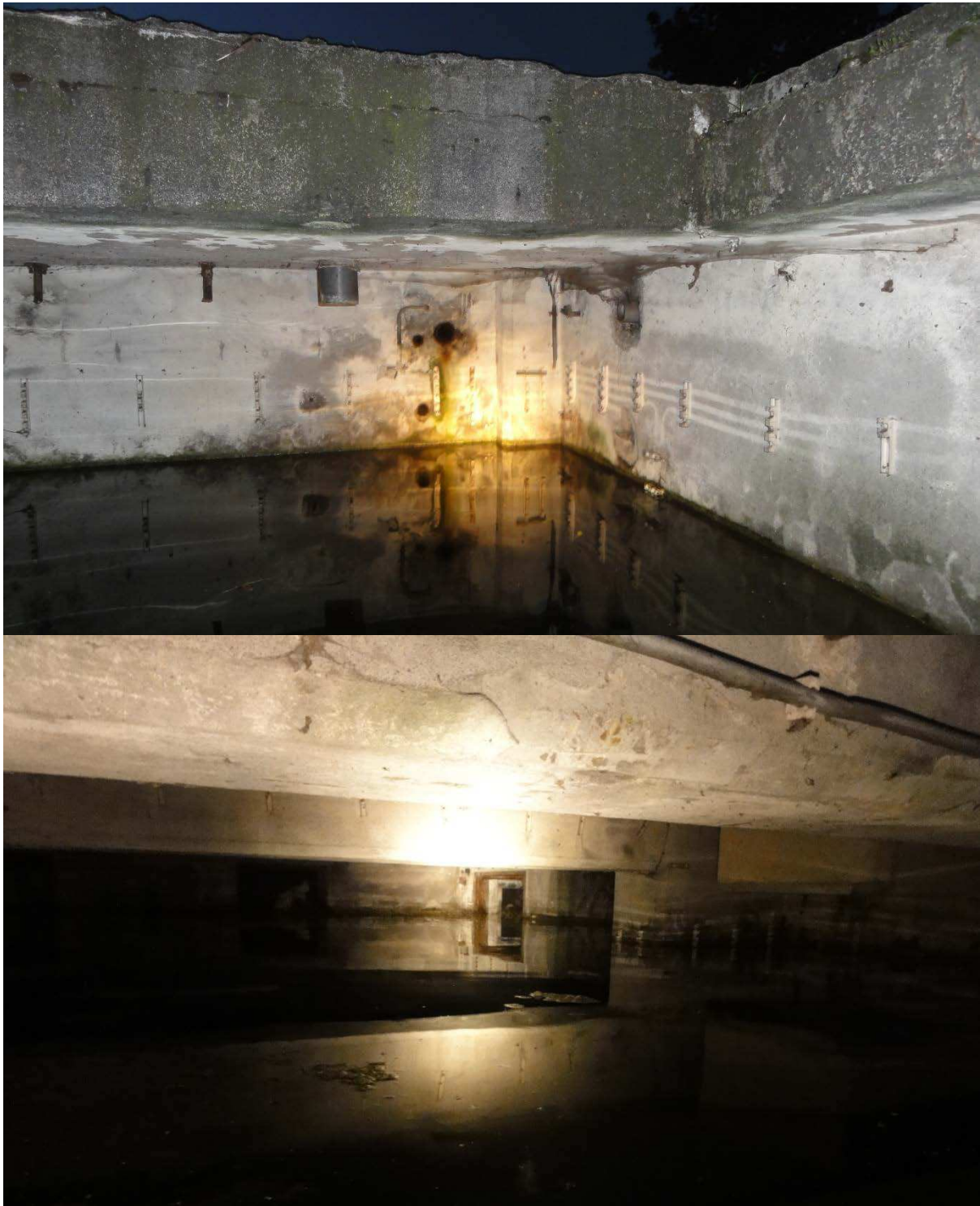
Figuur 4.5. Binnenzijde van kelder 3.