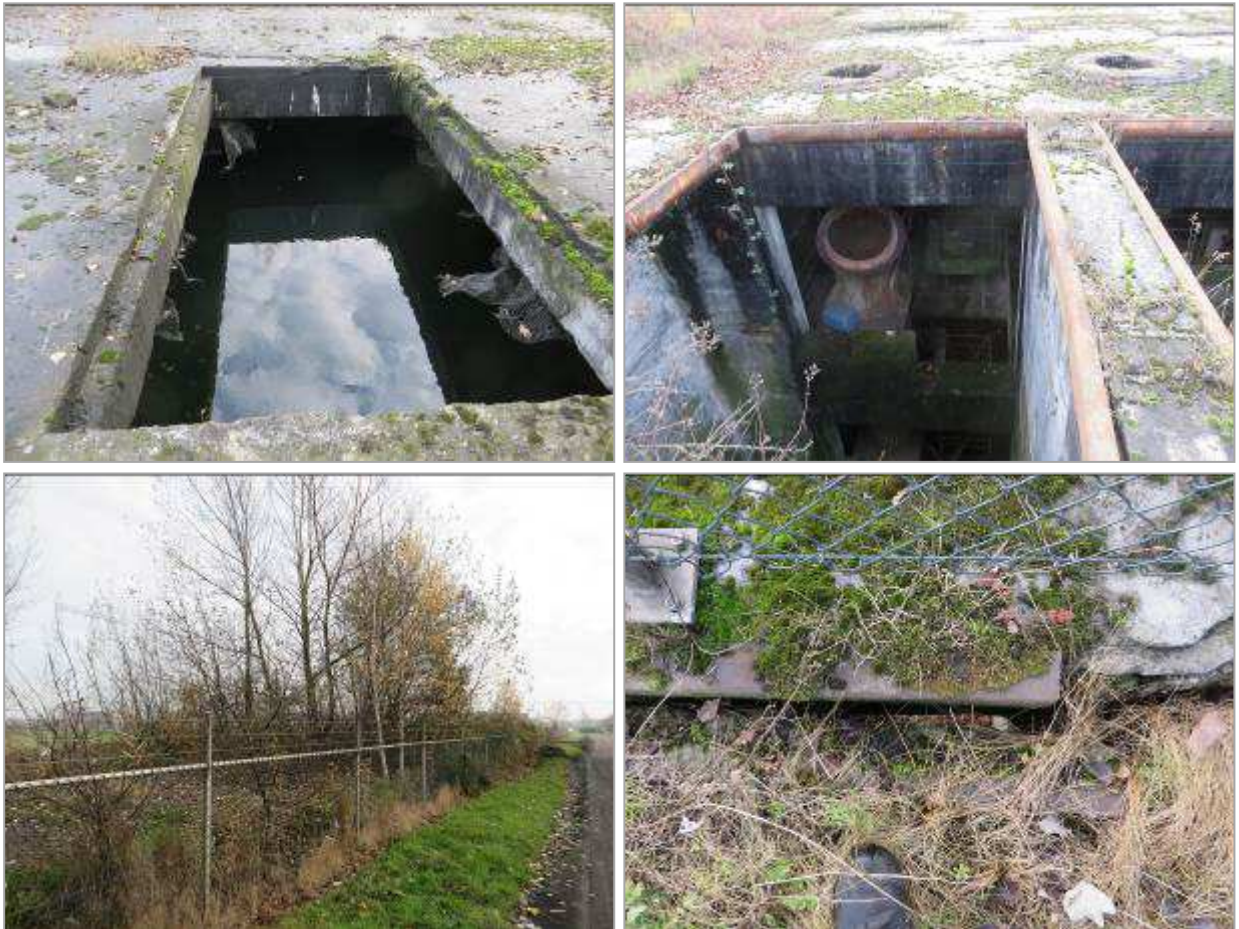
Afbeelding 1. De betreffende kelders. Van linksboven naar rechtsonder: de volgelopen kleine kelder, de grote kelder, het omheinde terrein en toegang tot de kelder van buitenaf. Foto's: J. Rijdsijk, 2014.