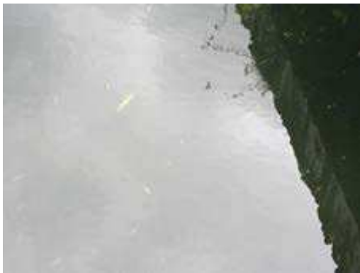
Afbeelding 2: vissen in noordelijke kelder

Uit ervaring met vergelijkbare terreinen blijkt dat waterkelders een gewilde plaats zijn voor vleermuizen om zich te vestigen. Tijdens deze quickscan zijn geen vleermuizen aangetroffen.