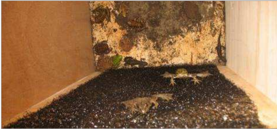
Afbeelding 4: Voorbeeld van een uitklimconstructie. Door de ruwe kunststofmat op het hout zijn amfibieën en andere kleine soorten in staat om naar boven te klimmen.

Bovenstaande afbeelding geeft aan hoe een uitklimconstructie voor amfibieën en eventueel reptielen eruit zou kunnen zien. Voor grotere zoogdieren volstaat een dergelijke constructie waarschijnlijk niet. Om de grotere zoogdieren ook een uitklimmogelijkheid te bieden kan gedacht worden aan het toepassen van een zogenaamde kattenladder, zie Afbeelding 5.