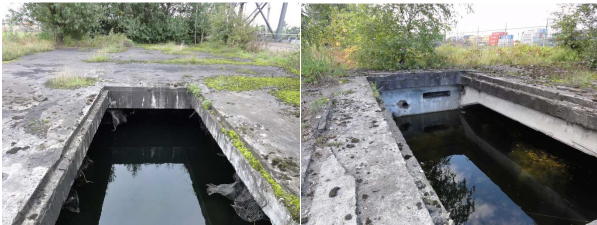
Figuur 3.2. Kelder 1 (links) en kelder 3 zijn beide grotendeels gevuld met water.