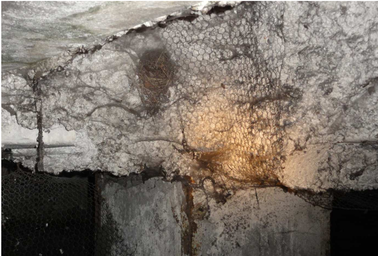
Figuur 4.1. Binnenzijde van kelder 1 met op onderste foto restant van zwaluwnest.

koelwaterinlaat worden ingezogen in deze kelder overzet. Er is geen directe toegang met het havenwater.