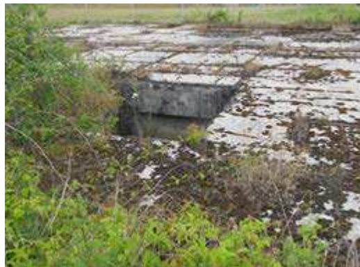
Afbeelding 3: zuidelijke kelder