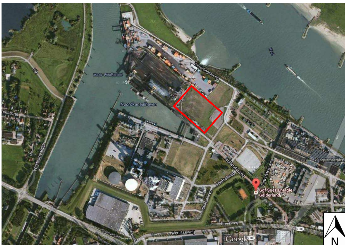
Afbeelding 1: voorziene locatie van de biomassacentrale (rood omlijnde rechthoek)

Het onderzoek betreft uitsluitend het deel van het plangebied 1 van de BEC dat op afbeelding 1 is aangegeven.