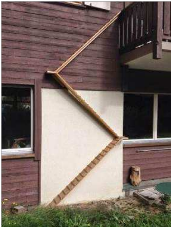
Afbeelding 5: Voorbeeld van een kattenladder. Een kattenladder kan goed dienen als uitklimconstructie voor grotere zoogdieren.

Bovenstaande afbeelding geeft aan hoe een uitklimconstructie voor amfibieën en eventueel reptielen eruit zou kunnen zien. Voor grotere zoogdieren volstaat een dergelijke constructie waarschijnlijk niet. Om de grotere zoogdieren ook een uitklimmogelijkheid te bieden kan gedacht worden aan het toepassen van een zogenaamde kattenladder, zie Afbeelding 5.