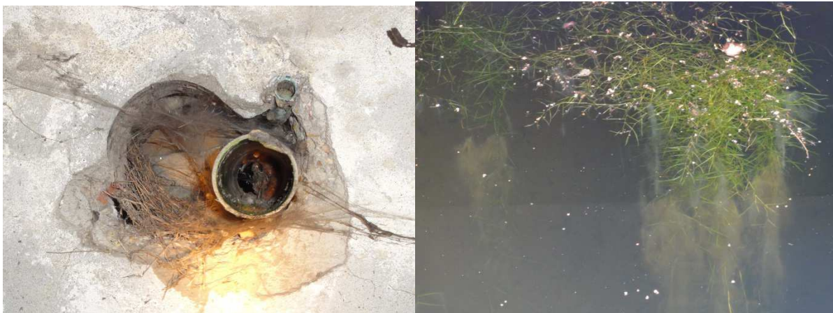
Figuur 4.4. Kelder 3 bevat nestmateriaal in een holte en waterplanten.

Er zijn geen beschermde planten in de kelders aangetroffen.