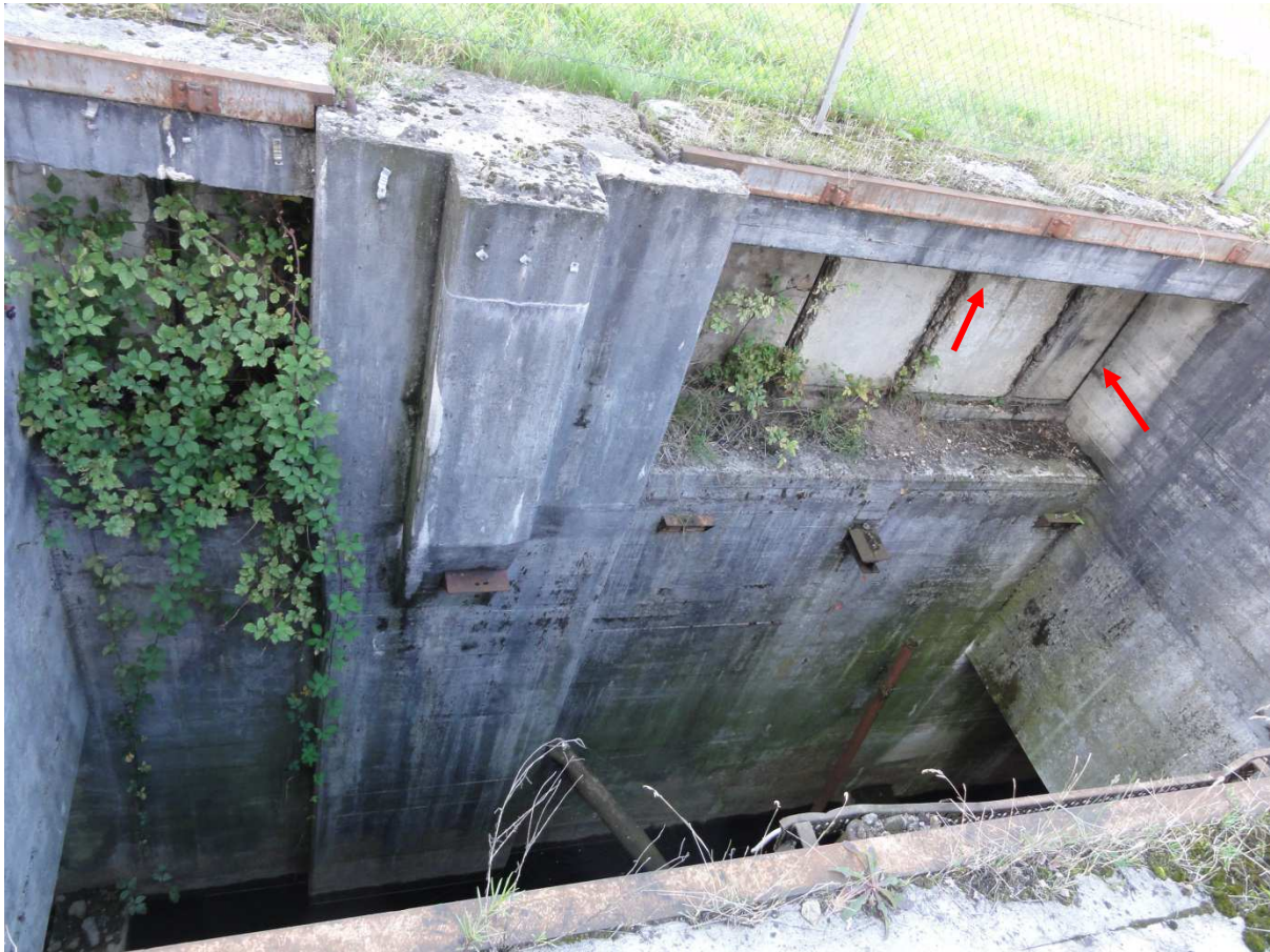
Figuur 4.2. Eén van de openingen in kelder 2. In de gehele noordwand van deze kelder zijn spleten tussen plafond en achterwand en zijwanden aanwezig waar vleermuizen kunnen verblijven.