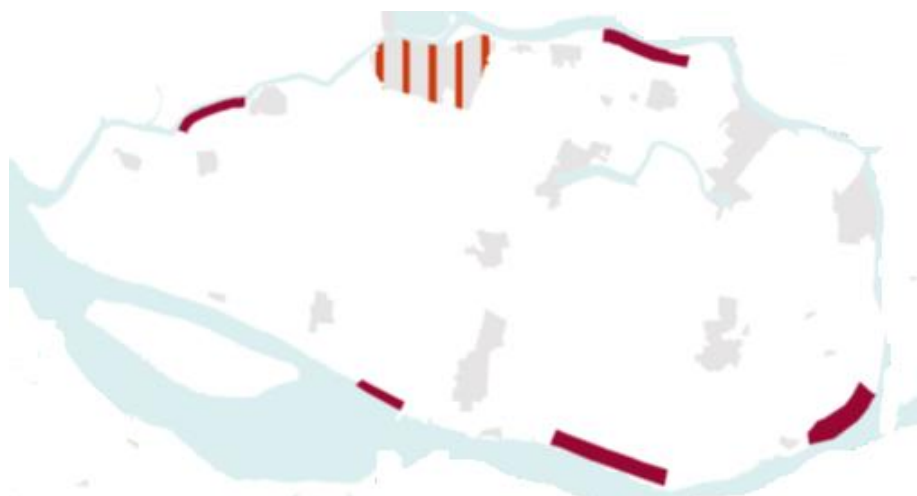
Figuur 2: Locaties windenergie, VRM 2014.

De beoogde locatie ligt in de westrand van de Hoeksche Waard. Voor dit gebied zijn op verschillende bestuurlijke niveaus ruimtelijke visies en/of visies met betrekking tot wind vastgesteld. De in de VRM opgenomen locaties windenergie in de Hoeksche Waard zijn het resultaat van een afweging tussen eisen vanuit windenergie en de randvoorwaarden vanuit landschap en ruimtelijke kwaliteit. Hieruit vloeit voort dat voor heel Zuid-Holland de voorkeur uitgaat naar lijnopstellingen ten opzichte van clusteropstellingen en dat deze lijnopstellingen gekoppeld zijn aan infrastructuur en/of waterwegen. Vanuit deze uitgangspunten zijn in Hoeksche Waard alleen locaties aangewezen langs de rand van het gebied (zie figuur 2).