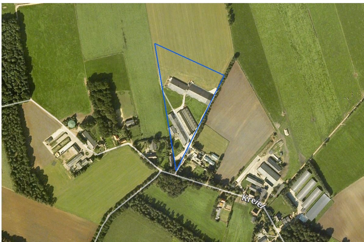
Afbeelding 1: ligging plangebied

Men is voornemens de twee oudere stallen te slopen en een nieuwe stal te realiseren ten noorden van de bestaande nieuwe stal.