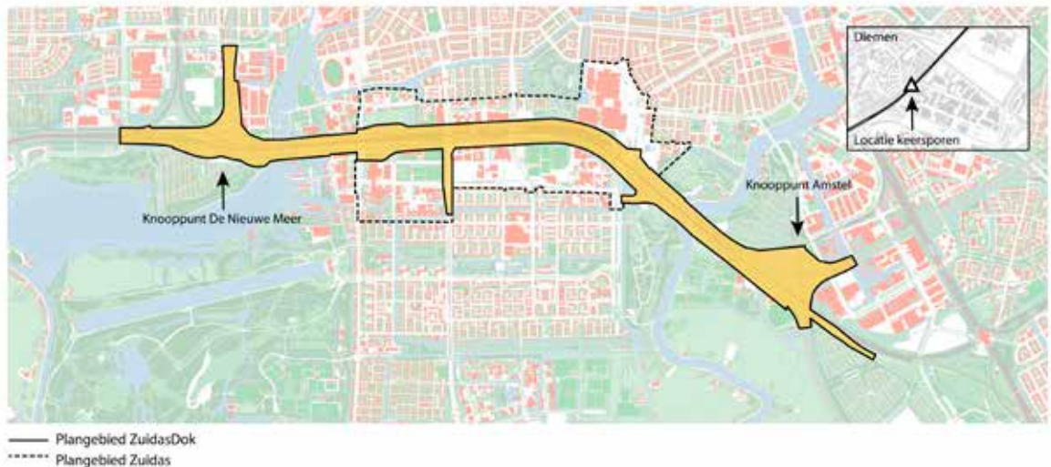
Afbeelding 2 Plangebied ZuidasDok (zie toelichting locatie keerspoeren in paragraaf 5.1)