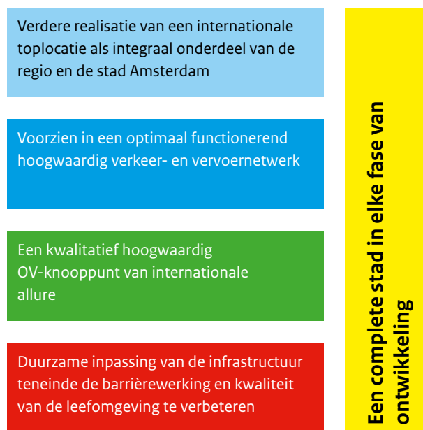
Afbeelding 1 Doelstellingen ZuidasDok 4+1

Voor ZuidasDok zijn vier doelstellingen geformuleerd 1 , zoals weergegeven in de horizontale blokken in Afbeelding 1. Deze doelstellingen zijn gericht op de ambities van een internationale toplocatie, met een optimaal functionerend verkeer- en vervoernetwerk, een hoogwaardig OV-knooppunt en een duurzame inpassing van infrastructuur. Als vijfde doelstelling is 'een complete stad in elke fase' toegevoegd. Het gaat hierbij om het borgen van het functioneren van de Zuidas tijdens de gehele realisatie, of te wel kwaliteit in elke fase. In deze paragraaf wordt elk van de doelstellingen kort toegelicht samen met de bijbehorende probleemstelling. Een complete probleemanalyse is opgenomen in het planMER ZuidasDok.