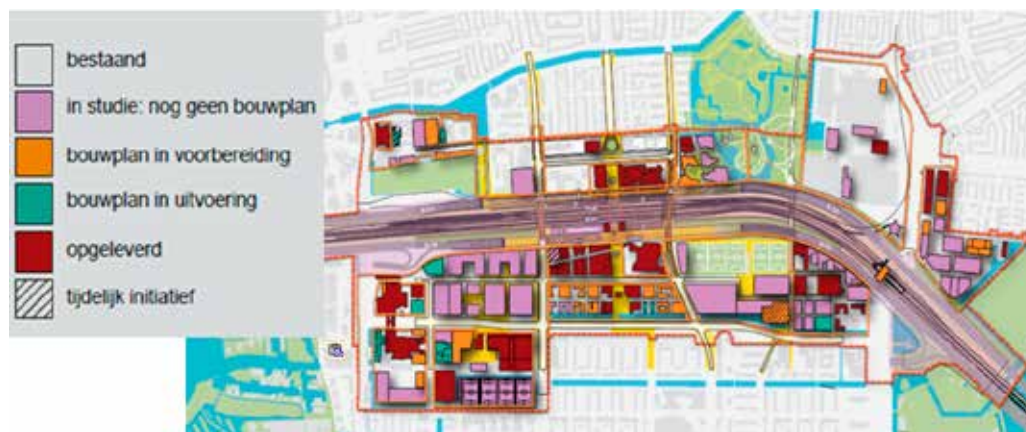
Afbeelding 5 Ontwikkelingen in de Zuidas flanken