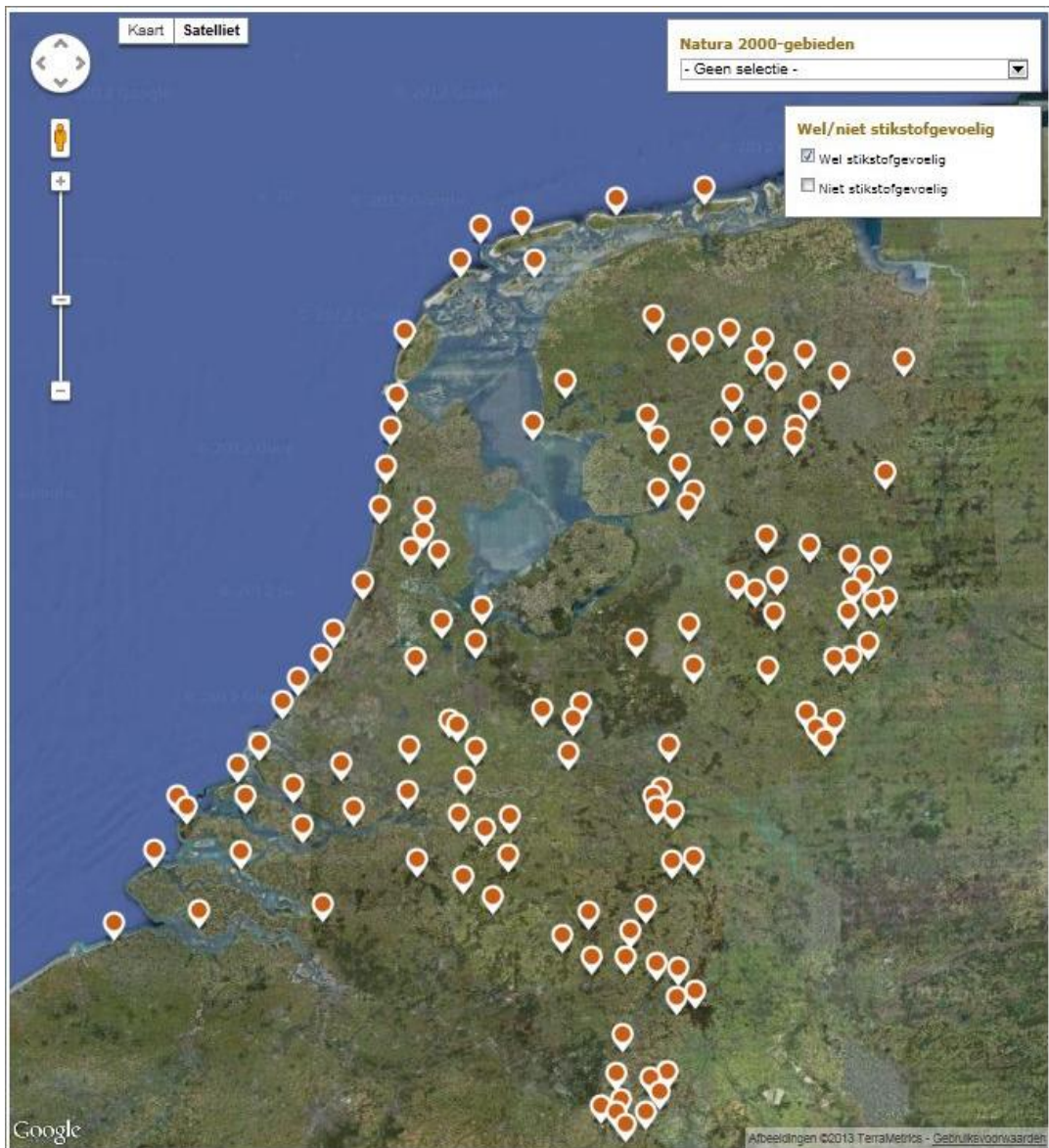
Kaart 1. Circa 133 gebieden die (d.d. 27 maart 2013) stikstofgevoelig zijn. Dit aantal kan lopende het PAS-proces fluctueren.

In circa 133 van de 163 Natura 2000-gebieden bevinden zich stikstofgevoelige habitats, zie kaart 1.