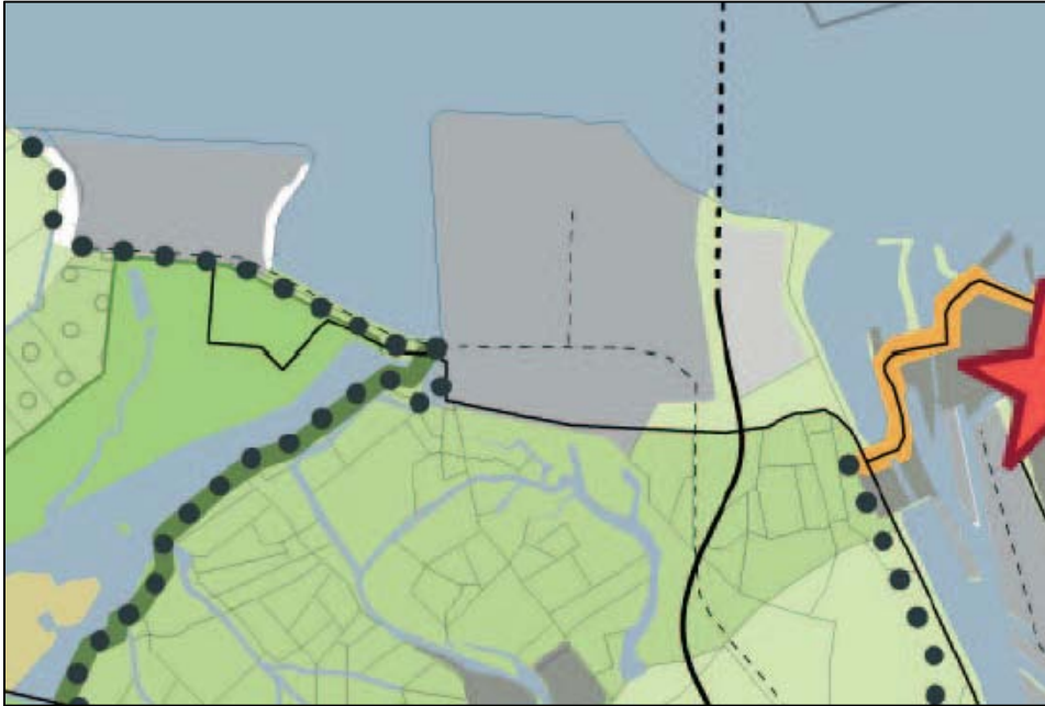
Figuur 2.3. Fragment visiekaart Structuurvisie 2025

De bestaande voorraad havengebonden bedrijventerreinen in de Kanaalzone biedt in combinatie met de nog binnen de planperiode te ontwikkelen of te herstructureren gebieden (doorontwikkeling Axelse Vlakte, Koegorspolder/Zijkanaal C, Ghellinkpolder-Noord, MVP) voorsnog voldoende mogelijkheden om de vraag in de komende 10 à 15 jaar op te vangen. Hierbij wordt wel opgemerkt dat er voor een aantal uitbreidingsgebieden, zoals MVP, specifieke vestigingsvoorwaarden gelden, zoals symbiose met de activiteiten van de industriële bedrijven die op naastgelegen bedrijventerreinen gevestigd zijn.