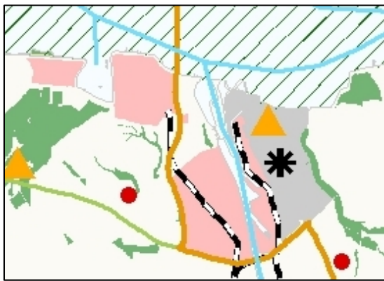
Figuur 2.2 Fragment Omgevingsplankaart

Het bestaande bedrijventerrein Logistiek Park is niet op de omgevingsplankaart aangeduid, maar wel in paragraaf 5.3.1. van de plantekst. Het wordt daarin beschouwd als een zeehaventerrein. Het te ontwikkelen Maintenance Valuepark is in het huidige omgevingsplan niet aangeduid.