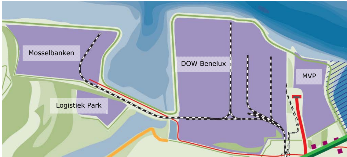
Figuur 1.1 ligging plangebied DOW Benelux, Mosselbanken, Logistiek Park en MVP