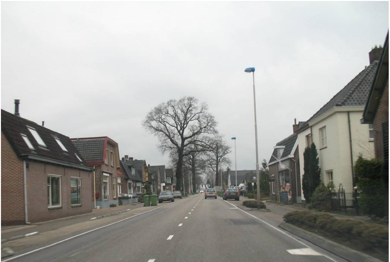
Verkenning N 345 Voorst Notitie Cultuurhistorie