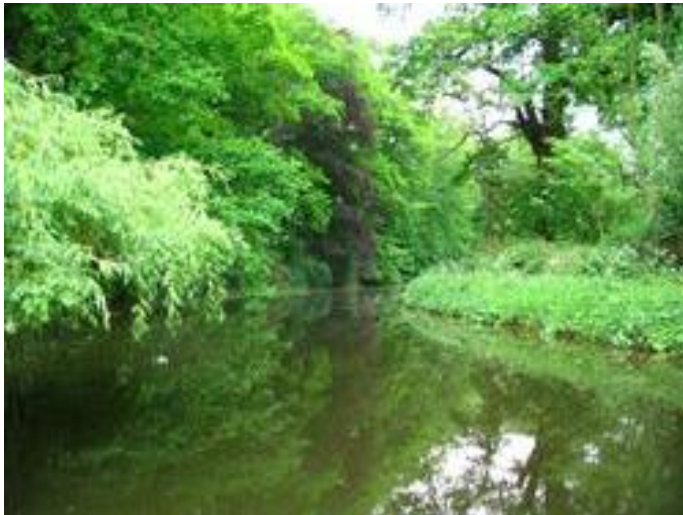
Afbeelding 3: Beekdal

De IJsselvallei is een nat gebied tussen de hogere Veluwerand en de oeverwallen bij de IJssel. Vanaf de Veluwse stuwwal stroomt water via beken in een west-oostpatroon naar de IJssel. Vanwege het schone water en de waterkracht uit de natuurlijke beken en sprengen hebben nijverheid en industrie zich ontwikkeld. Vooral de papierindustrie floreerde in het gebied in de 17e eeuw. De Voorsterbeek is een sprengenbeek met bijbehorende (verdwenen) watermolens. De beek stroomt vanaf de Veluwe en loopt iets ten noorden van het dorp.