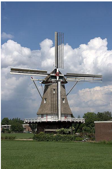
Figuur 1: Molen De Zwaan