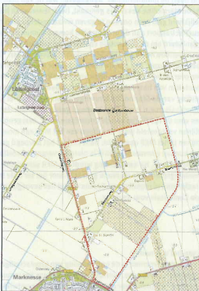
Figuur S.1: Overzichtkaart van de huidige situatie met daarin aangegeven de grenzen van het plangebied, wegen, waterstructuur, bestaande glastuinbouwbedrijven en de uitbreiding van Luttelgeest

De gemeente Noordoostpolder heeft daarom besloten een nieuw bestemmingsplan voor het beoogde gebied op te stellen. Dit bestemmingsplan dient beter aan te sluiten op de ontwikkelingen van grootschalige glastuinbouwbedrijven in het plangebied. Daarnaast wenst de gemeente aan het nieuwe bestemmingsplan een Exploitatieplan te koppelen zodat de kosten voor openbare en bovenplanse voorzieningen kunnen worden verhaald.