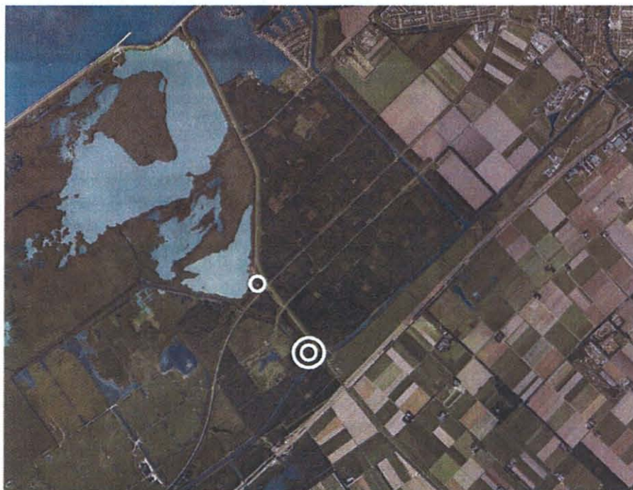
Figuur 1.1. Huidige locatie (enkele witte cirkel) en beoogde locatie (dubbele witte cirkel) nieuwe NAC

De beoogde nieuwe locatie voor het NAC is gesitueerd in het Oostvaardersveld. De locatie is gelegen aan de Knardijk, nabij de Lage Vaart. Het Oostvaardersveld vormt een onderdeel van de (Nationale) Ecologische Hoofdstructuur (EHS). De nieuwe locatie ligt op een afstand van ongeveer 1,3 km van de huidige locatie.