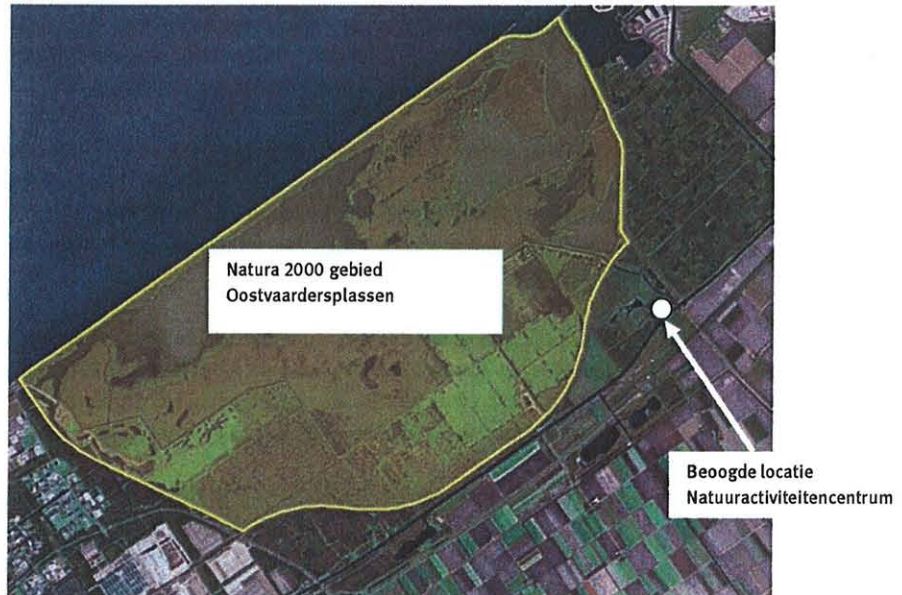
Figuur 1.2. Natura-2000 gebied Oostvaardersplassen.

In onderstaande figuur is de begrenzing van het Vogelrichtlijngebied Oostvaardersplassen weergegeven.