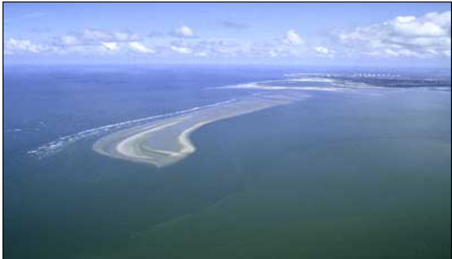
Maasvlakte en Voordelta

Het zeereservaat is een compensatiemaatregel die binnen het resterende deel van de beschermingszone Voordelta een dusdanige kwaliteitsverbetering oplevert dat de negatieve effecten van aanleg van de Tweede Maasvlakte op de natuurwaarden daarmee worden gecompenseerd. Het gaat daarbij vooral om het verlies van zeebodem, de organismen die daar leven en de soorten hoger in de voedselketen (met name vogels) die daardoor (direct en indirect) voedselbronnen verliezen.