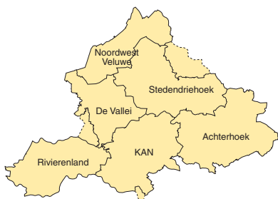
Kaart A1 Knelpunten bereikbaarheid

van het PVVP-2 besteden wij hier aandacht aan in navolging van het rijksbeleid.