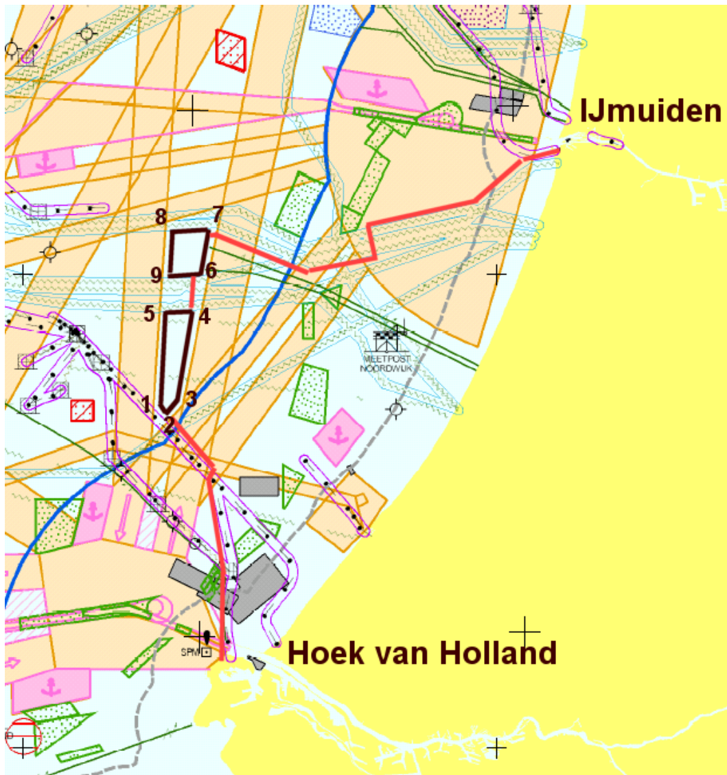
Figuur 1: Locatie Offshore Windpark Katwijk

De coördinaten van de 9 hoekpunten van het windpark zijn in onderste tabel aangeven.