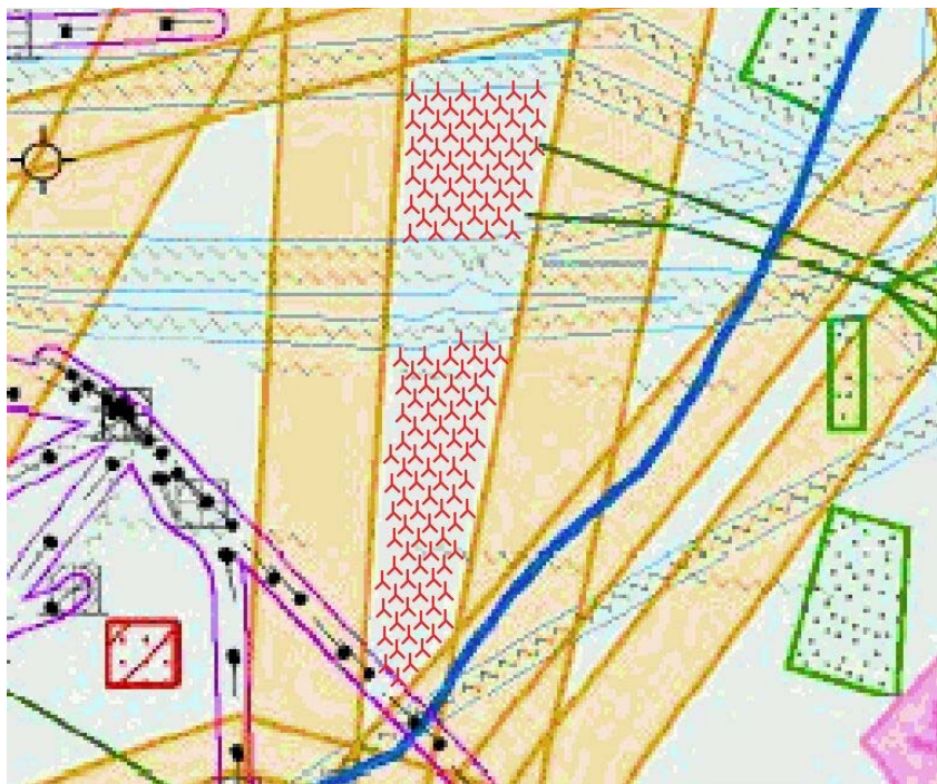
Figuur 3: Basisvariant met turbines uit de 3 MW klasse

Uit het I-MER NSW is tevens naar voren gekomen dat overige vormen van het windpark weinig tot geen toegevoegde waarde hebben ten opzichte van bovengenoemde varianten. Derhalve worden naast de basisvariant en de compacte variant in dit MER geen andere parkopstellingen onderzocht.