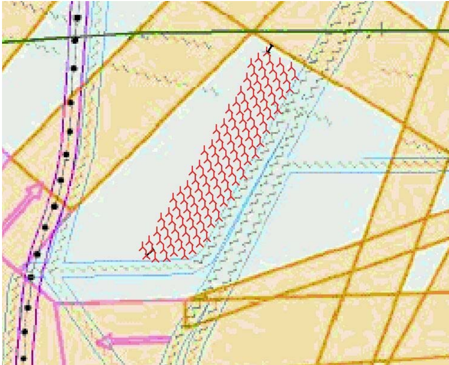
Figuur 3: Basisvariant met turbines uit de 3 MW klasse

Uit het I-MER NSW is tevens naar voren gekomen dat overige vormen van het windpark weinig tot geen toegevoegde waarde hebben ten opzichte van bovengenoemde varianten. Derhalve worden naast de basisvariant en de compacte variant in dit MER geen andere parkopstellingen onderzocht.