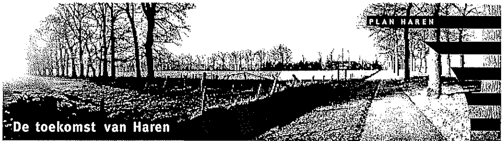
De toekomst van Haren