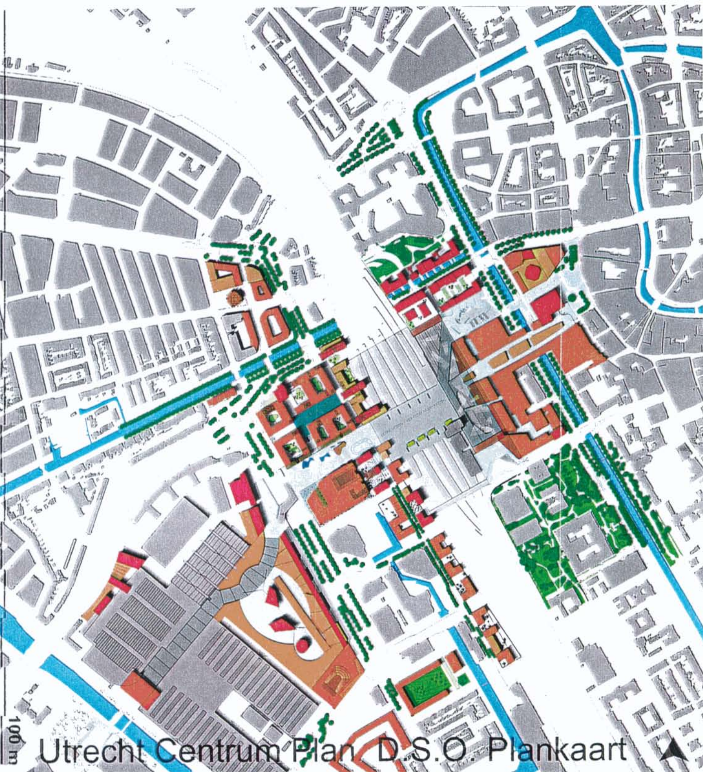
Figuur 2: het DSO voor het UCP-gebied