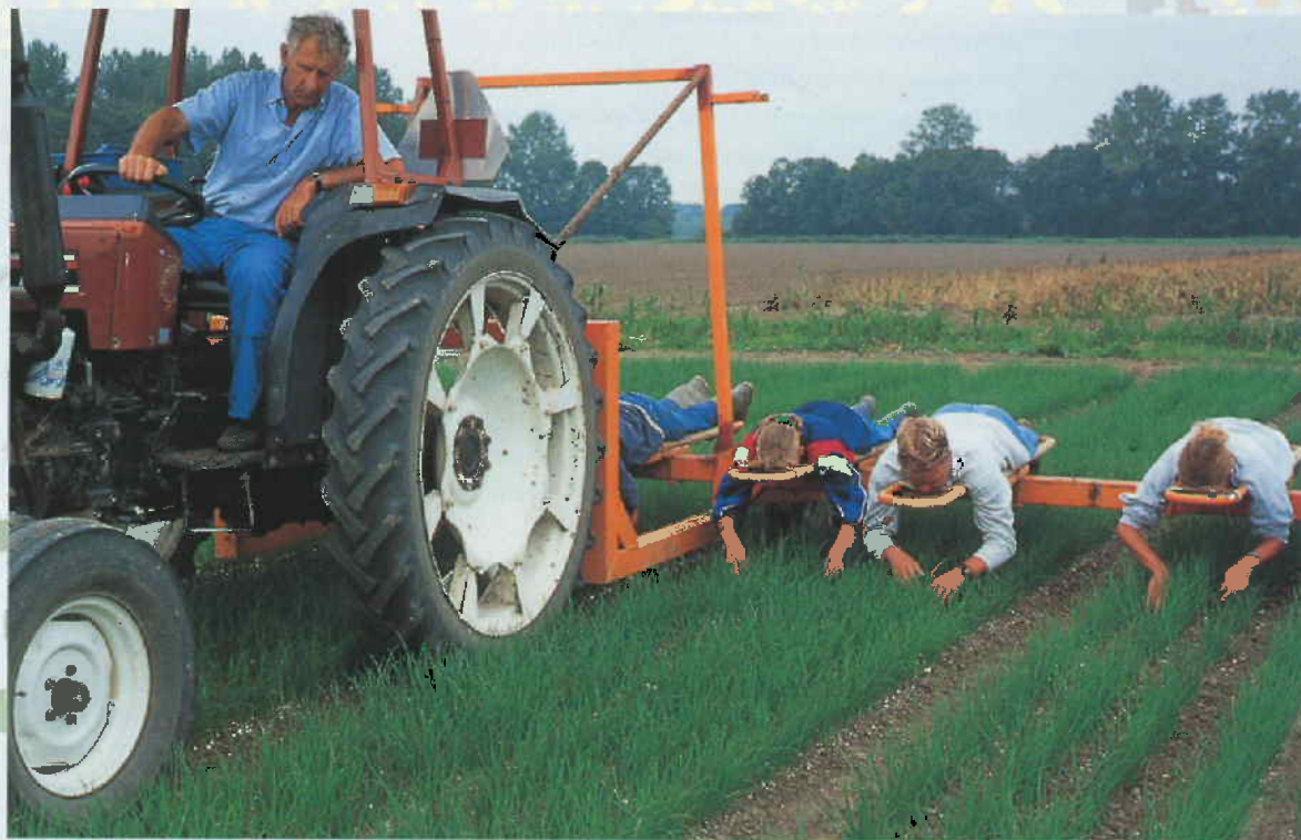
Onkruidwieders aan het werk

De provincie wil de gebiedseigen kwaliteit van de bodem beschermen. Dit wordt vertaald in het voorschrijven van bodembeschermende voorzieningen bij de vergunningverlening aan bedrijven en in het stimuleren van de landbouwsector om het gebruik van meststoffen en chemische bestrijdingsmiddelen terug te dringen.