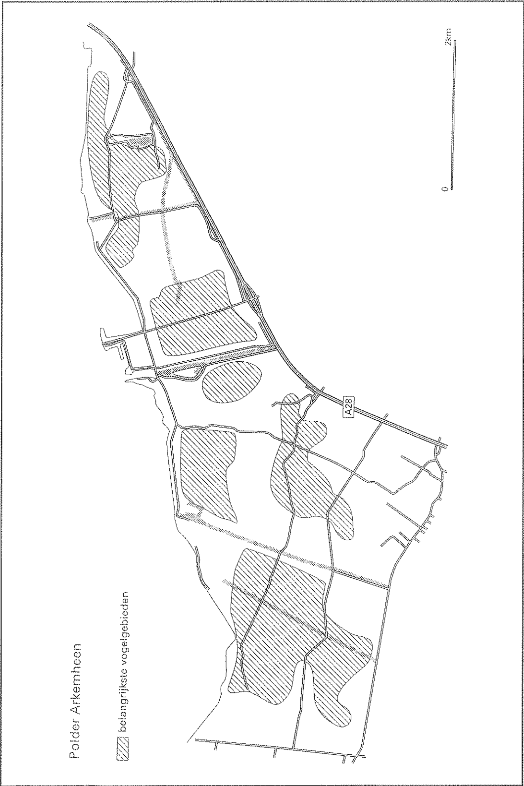
Kaart van de belangrijkste weidevogelgebieden